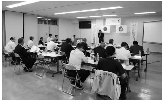
設立総会および・第1回総会の様子

※ねりんピックとは、60歳以上の方を中心としたスポーツと文化の祭典です。昭和63年より毎年各都道府県で開催されており、例年、スポーツ・文化交流大会には全国から約1万人の選手・役員が参加しています。