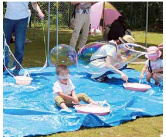
志賀野フェスタ イベントを楽しむ子どもたち

といった生活病、失明上位の加齢黄斑変性といった疾患までテレビ等で紹介されていますが、これらの疾患は、痛くも痒くもないのです。（ドライアイは痛い事もあります。）なんと、「かすむ、ぼやける」といった症状で見つかることがあるのです。 現在、午前中は毎日診察、午後は特殊外来（個人検査）という予定になっていますので、お気軽に眼科外来にお問い合わせください。なお、第2、4火曜日は、14時から15時の間、コンタクト外来も行っています。これからもよろしくお願ひします。