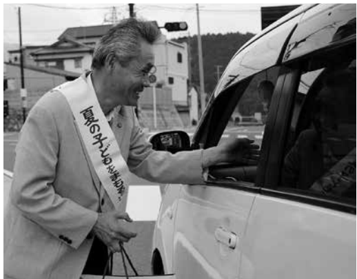
昨年の街頭啓発の様子

第54回「夏の子どもをまもる運動」 7月1日～8月31日 ～みんな そろって すこやかに～ “明るく・正しく・たくましく”