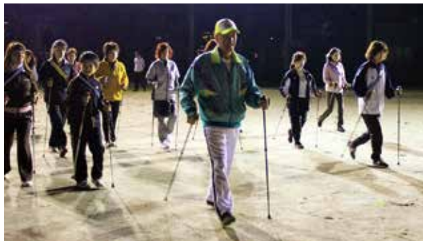
ノルディックウォークのイメージ