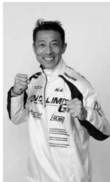
■ゲストランナー 森脇 健児 さん ・松竹芸能株式会社所属