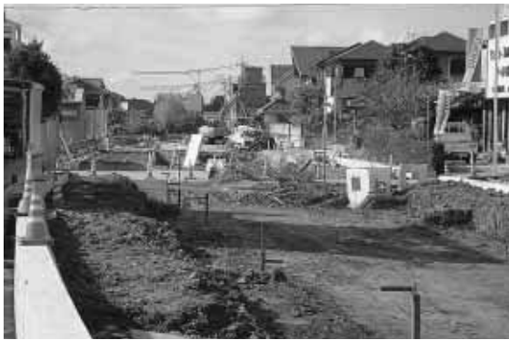
工事が進む県道奥佐々阪井線（野鉄代替道路・小畑地区）