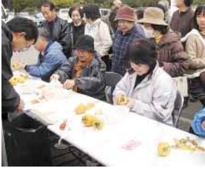
つるし柿の体験コーナー

会場内では軽食・農林海産物・日用品の販売コーナーをはじめ、「柿種飛ばし・柿皮むき大会」、「餅投げ」などの多彩なイベントのほか、よさこい踊り(紀道)や紀美野町吹奏楽団による演奏も披露されました。訪れた人たちは、イベントに参加したり、農産物などを買い求めたりして、秋の一日を満喫されていました。また、農産物品評会では、