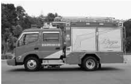
新たに配備した救助工作車（上）・高規格救急車（下）