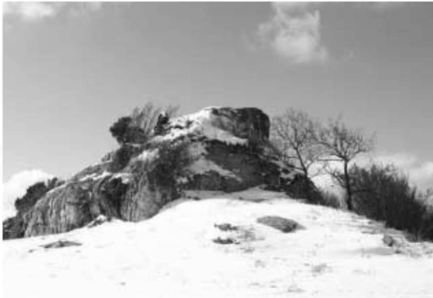
(写真) 生石山冬景色

です。この山間の町を輝かせるには、地域の教育力・文化力を高めることが大切だと思っております。高野西街道にはどの集落にもその底力があると確信が持てる四年間でした。私達は、先人が大切にしてきたものを受け継ぎます。過去を変えることが出来ないが未来は私達の手の中にあるのです。子ども達が輝き、大人が学び続けて心豊かに生きる学びの郷を目指しています。本年もご指導、ご支援をよろしく願います。