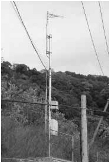
町道福田松瀬線 （福田地区） 各家庭に地上デジタル放送の電波を送る送信アンテナ（町内60箇所）

現在、進められています平成21年度事業を見ますと、道路関係では平中通り2号線や福田松瀬線、谷線など町道10路線、林道毛原下滝ノ川線、農道段子峯線、また、県道では奥佐々阪井線（野鉄代替道路）など3路線、国道370号（2ヶ所）で、それぞれ新設・改良工事が行われています。 生活関連事業では、合併処理浄化槽の設置（50基）、地籍調査事業（三尾川・鎌滝地区の一部）等が実施されています。また、野上第1保育所の新築工事が完成したほか、地上デジタル放送難視聴対策工事も3月完成予定となっています。 このほか、ソフト事業を含め、新規事業や継続事業が実施されています。