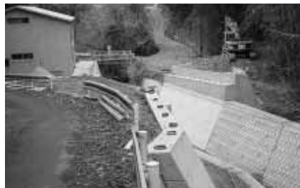
町道柴目七山バイパス線 （長谷地区）