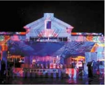
光のアート D-K LIVE

同校と地域住民らでつくる実行委員会が、世帯を繋ごう、人を結ぼう、世界の国境を超えよう、ONENESS"をテーマに開いたもので、同校の生徒や世界各国の人たちが民族舞踊や音楽を披露し、観客から大きな拍手が上っていました。また、会場内には世界各国の料理などを