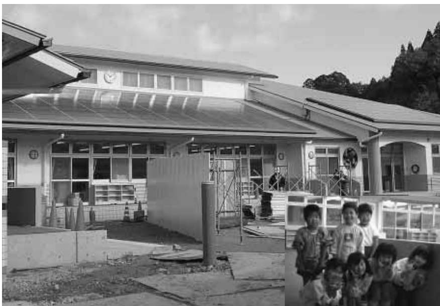
完成した野上第1保育所（動木）

結びに、本年が皆様にとって希望に満ちた良い年となりますことを心よりご祈念申し上げます。年頭の挨拶いたします。