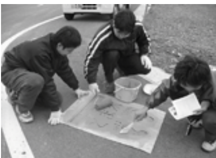
路面に“足跡”などを描く会員の皆さん

関係者によって八重桜などの記念植樹が行われた後、社員の皆さんは、和歌山県森林組合の職員の指導のもと、山桜やケヤキなど7種類の広葉樹の苗木250本を植樹しました。社員の方からは、「景色の良い所ですね。植えた桜が大きくなつて、きれいな山になるのが楽しみです。」と話していました。 企業の森は、本町では3社目となります。