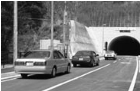
関係者が通り初めをして供用が開始されました。

地域の交通の利便性が向上するとともに、みさと天文台や美里温泉かじか荘等をはじめとする周辺観光地と和歌山、那賀地方、南大阪圏都市とのアクセスの向上が図られ、町の活性化につながると期待されます。