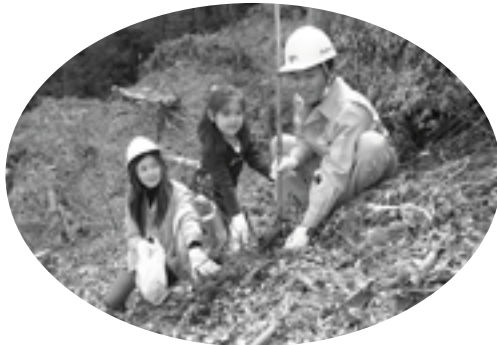
植林をする社員の皆さん

関係者によって八重桜などの記念植樹が行われた後、社員の皆さんは、和歌山県森林組合の職員の指導のもと、山桜やケヤキなど7種類の広葉樹の苗木250本を植樹しました。社員の方からは、「景色の良い所ですね。植えた桜が大きくなつて、きれいな山になるのが楽しみです。」と話していました。 企業の森は、本町では3社目となります。