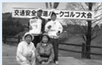
優勝された皆さん