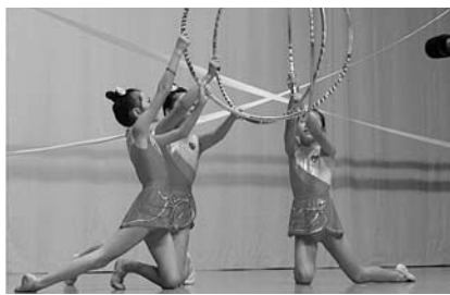
■活動日時: 毎週日曜日 午前9時30分～11時30分 ■場所: 農村総合センター体育室

みさと新体操クラブは今年で創設8年目を迎えます。新体操は、ボール・ロープ・リボン・フープといった種を持って演技する競技です。「知らない競技だな」「難しいかも」と思う人もいると思いますが、みさと新体操クラブは身体の基本作りから始めるので心配いりません! もちろん種具を使う競技もします。部員は年中児から小学校6年生までの20人、皆で仲良く練習しています。活動は文化祭の舞台発表などが主で、衣装を考えたり、子どもにメイクをします。親も一緒に楽しんで