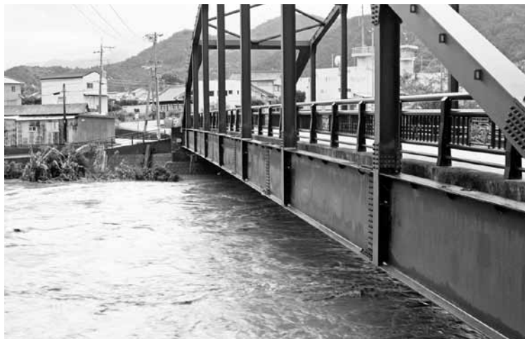
水位が一時橋げたまで達した吉見橋（下佐々地区）

道路の損壊、田畑崩落、水田の冠水など広い範囲にわたり被害をもたらしました。なお、町では自然災害や火災などによる被災者の生活再建支援のための災害支援制度を設けていますので、詳しくは町