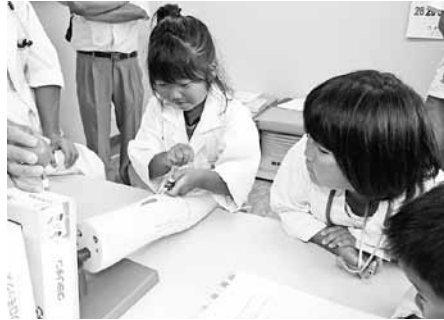
採血デモ機を使って、採血に挑戦する子ども

そして、夏休みの思い出づくりにと開きました。白衣を着た子どもたちは、「キッズカルテ」に従って、医師や看護師の指導のもと保護者らが患者役となり、脈拍や血圧を測ったり、聴診器で呼吸、心臓の音を聴いたり、往診に出かけたりと診療の疑似体験をしました。