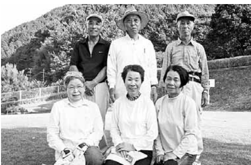
上位入賞者の皆さん