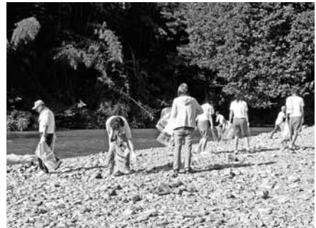
河川敷でごみを拾う参加者たち