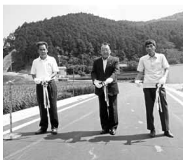
テープカット（写真左より北谷福田地区区長、寺本町長、中家建設委員長）