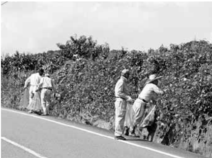
道路側溝に捨てられた空き缶などを拾い集める参加者たち

かみふれあい公園に通じる町道長谷国木原線をはじめ雨山サンリゾートラインなど5路線で、地元ボランティアや町職員ら約40名が参加して行われ、道路側溝などに捨てられた空き缶やゴミを拾い集めました。