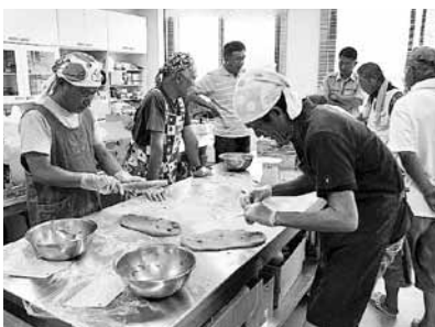
自分たちで育てた「小麦」でパンづくりをする参加者の皆さん

昨年11月から月1回のペースで行ってきた「小麦・野菜の栽培研修」。和歌山市内や大阪から移住を考えておられる方や農業に興味のある方と野菜や小麦を育ててきました。今回はその集大成として、種から育て、収穫した小麦を、粉に挽き、パンを作って食べました。農業の大変さ、食の大切さを通して田舎暮らしをより深く理解してもらえたのではないかと思っています。 この研修で実際に紀美野町に定住された方もいらっしゃいますし、農業を始められた方もいらっしゃいます。今後このような農業研修などを行っていき、町の気候や自然の恵みを知っていただく機会を増やしていきたいと思っております。