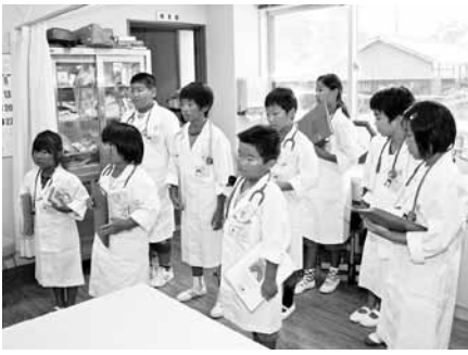
白衣姿の子どもたち

8月18日、長谷毛原診療所で小学生を対象とした「キッズドクターになろう!」診療所でお仕事体験が開かれ、毛原小学校の児童10人が参加しました。これは、同診療所が子どもたちに診療所を、より身近に感じてもらうようと、