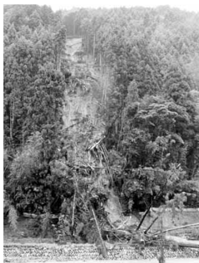
山林崩壊（今西地区）

ホームページ又は、今月のかいらん「台風12号により被害にあわれた方へ」をご覧ください。