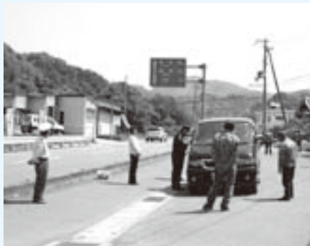
四輪車点検(5月19日・長谷地区)