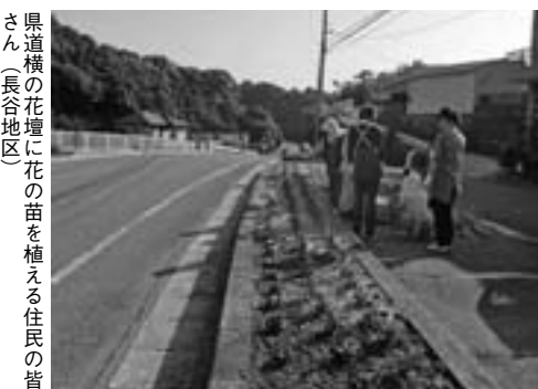
県道横の花壇に花の苗を植える住民の皆さん(長谷地区)