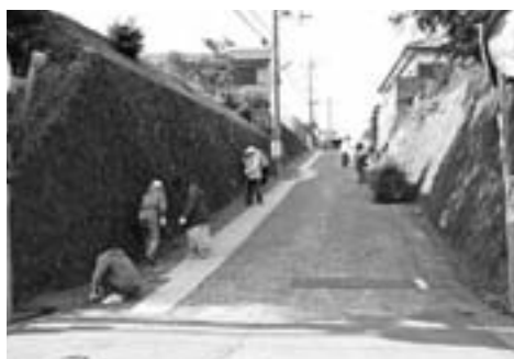
道路脇の草刈りや清掃をする住民の皆さん(希望ヶ丘地区)

また、花いっぱい運動の一環として、町よりサルビア、マリーゴールド、ペゴニアの花の苗(約8千本)が各地区や学校、公共施設に配られ、それぞれ植えられました。これからもさらに美しいまちをめざして、ご協力をお願いします。