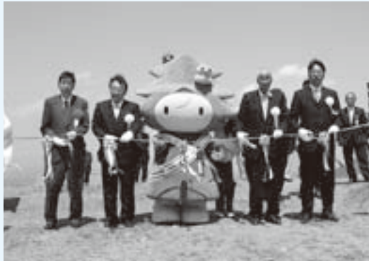
テープカット(中央は「第62回全国植樹祭」のキャラクター「キノピー」)

これから生石高原は、ハイキングやキャンプ、そして秋のススキの名所として、県内外から多くの観光客が訪れます。