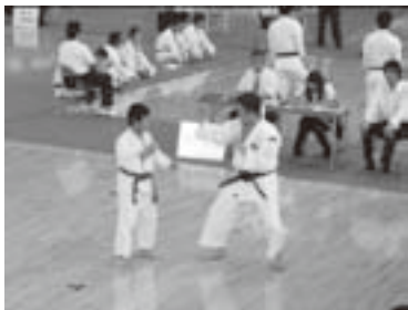
昨年和歌山県大会に参加した親子演武

練習は、始めに道場の掃除を行い、その後精神を修めるための「鎮魂業」を行います。引き続き指導者による講話をします。主な内容は「人として大事な行動、考え方等」です。最近では、大震災等について共に考えました。その結果、子供達が進んで募金箱を作ってくれました。技の練習は基本をみっちり行い、その後各レベルに別れて二人一組で行います。