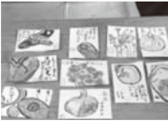
*地域サロン「グリーンクラブ」(緑ヶ丘)の皆さんと絵手紙体験をしました。

1日 おはなし会 8日 フラフープで遊ぼう 15日 折り紙でアジサイ作り 22・29日 七夕飾りを作ろう