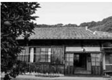
すぐに使用可能な家、別棟の情報、生活必需品の提供などお待ちしております。