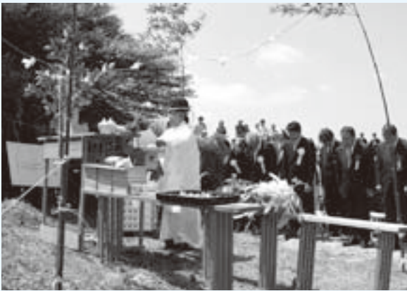
登山客らの安全を祈願する神事