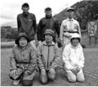
上位入賞者の皆さん

また、5月9日には、ふれあい公園パークゴルフ場で第11回パークゴルフ大会が開かれ、136人の会員がパーク