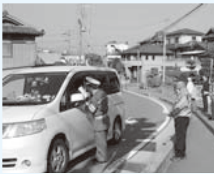
街頭啓発(5月18日・動木地区)

5月11日から実施されました春の全国交通安全運動が5月20日に終了しました。期間中、海南警察署をはじめ交通指導員、また、和歌山県自動車整備振興会の会員である町内整備工場協力のもと、