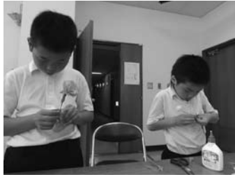
心をこめて作った カーネーション! 母の日にプレゼント