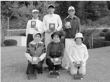
上位入賞者の皆さん