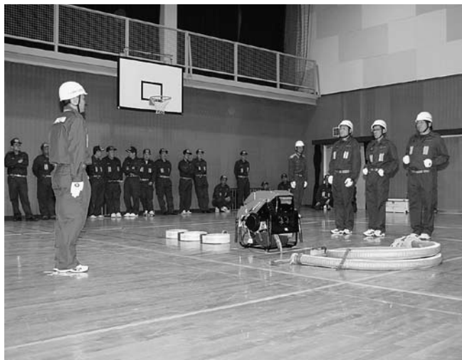
分団員らが見守る中、初練習に臨む選手たち

の6名です。選手の皆さんは、これから大会に向け、毎週2回（火曜日、金曜日）、午後7時30分から9時30分まで上神野スポーツ公園で練習に励まれます。