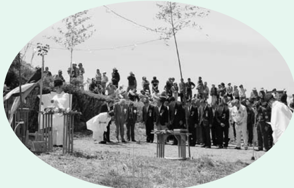
登山者らの安全を祈願する神事

緑の高原を満喫していただきました。また、午後からは海南高校美里分校の生徒による和太鼓の演奏や恒例の景品付き餅投げが行われました。 年間約4万人が訪れる生石高原は、これからハイキングやキャンプ、そして、秋のスキの名所として、県内外から多くの観光客でにぎわいます。