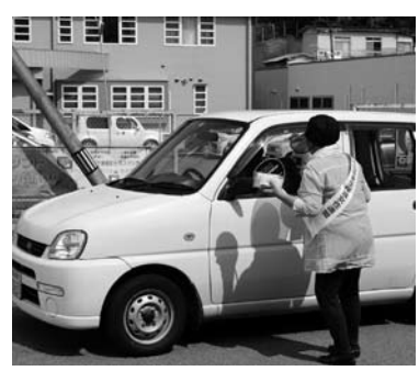
昨年の街頭啓発より