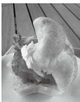
「みろく牧場のハンバーガー」 みろく牧場で、美味しいものを買うと宿題に便利な観測シートをゲットできます。