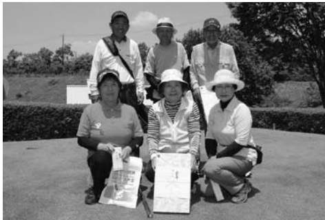
上位入賞者の皆さん

春の全国交通安全運動期間中の5月20日、のかみふれあい公園で第7回紀美野町交通安全推進パークゴルフ大会が開かれ、高齢者58名が東西コース(18ホール)でパークゴルフを楽しみました。