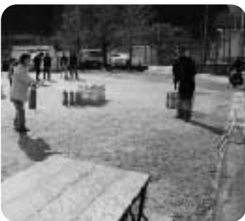
訓練用水消火器を使った訓練

3月2日には、はじめて小川地区自主防災組織で訓練用水消火器を使った訓練を行い、全員が消火器使用訓練と起震車による地震体験訓練を真剣に取り組みました。