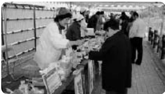
特産品を買い求める人たち