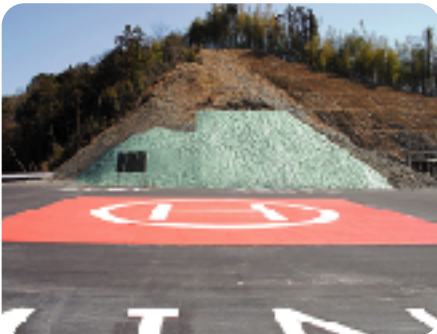
文化センター北側

この緊急離発着場は、災害時において、被害状況等の調査及び情報収集活動、救急患者や医療従事者等の搬送及び医療器材等の輸送、また、被災者等の救出、救援物資、人員の搬送等様々な用途において、防災機能強化に役立つものと考えています。