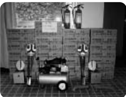
購入した自主防災パワーアップ資機材