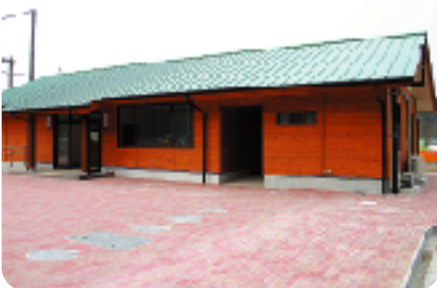
完成したクラブハウス

面積: 6,285㎡ (62.6m × 100.4m) ホッケー1面、サッカー1面、フットサル2面 夜間照明設備完備