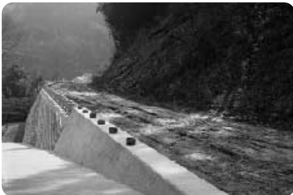
町道動木志賀野線(釜滝地区)