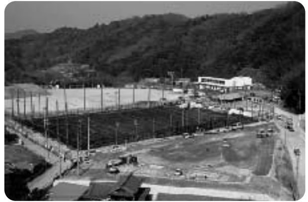
若もの広場リニューアル事業