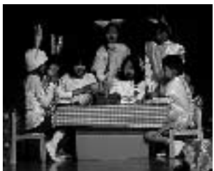
昨年のミュージカル風景