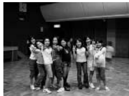
みんなで「イエーイ！」