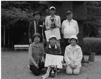
上位入賞者の皆さん（ゲートゴルフ）

10月1日、ふれあい公園パークゴルフ場で紀美野町老人クラブ連合会主催の第14回パークゴルフ大会が開かれ、80人の会員がパークゴルフを楽しみました。