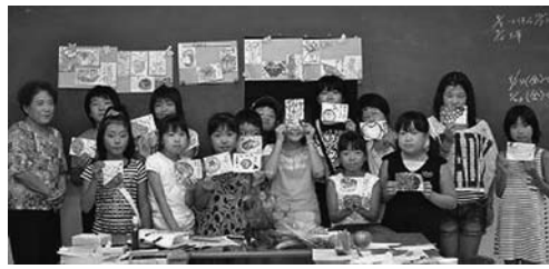
地域サロン（グリーンクラブ）のみなさんと楽しく 絵手紙を描きました。