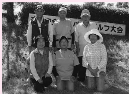
上位入賞者の皆さん

い公園で第6回紀美野町交通安全推進パークゴルフ大会が開かれ、高齢者65名が東西コース(18ホール)でパークゴルフを楽しみました。結果は上記のとおりです。数字はスコアです。(敬称略)