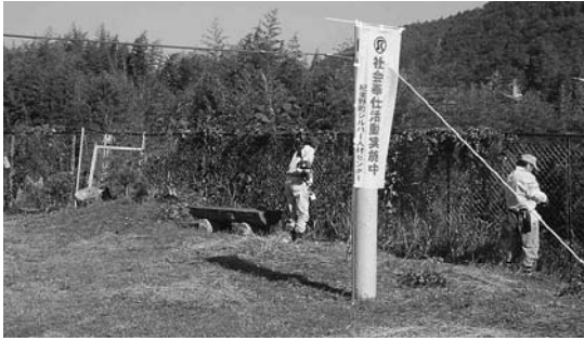
園内の草刈りをする会員（野上第2保育所で）

紀美野町シルバー人材センターでは、10月の全国一斉「シルバー人材センター事業普及啓発促進月間の一環として、10月16日（火）に町内各保育所の花壇の清掃や花の植え付けなどのボランティア活動を行いました。