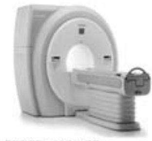
最新型東芝1.5テスラMRI装置