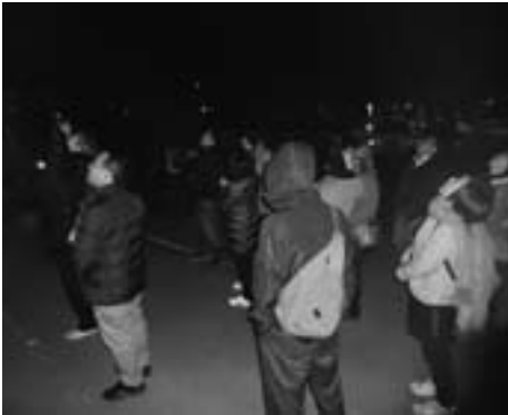
星空サークル (毎月第2水曜) では、中央公民館 駐車場で星を 見上げます。

紀美野町の皆さんが暖かく見守ってくださったからこそ今日まで活動してこられました。皆さんのご支援・ご協力に深く感謝します。と、振り返ってばかりもいられません。この先の10年、日本一の公開天文台をめざし、これからも皆さんと一緒に頑張っていきます。