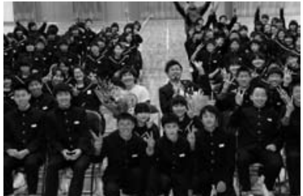
【平成26年度予餞会の様子】

本年度も、生徒会を中心に、2月から予餞会の取り組みが始まっています。3年生の輝かしい門出を在校生全員で創りあげていきます。