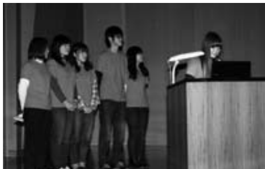
地域インターンシッププログラムについて発表する和歌山大学観光学部の学生の皆さん