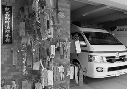
消防署前の笹飾り

り」が行われました。園児たちは、「ひあそびしませんが、「ひのようじん」といった防火の誓いや、「かめんらいだーになりたい」、「プリンキュアになりたい」、「オリンピックせんしゅになりたい」、「ダンスがじょうずになりたい」、「など色々な願いのこもった短冊ときらびやかな飾りを笹いっばいにつるした見事な笹飾りを完成させました。また、園児から頂いた笹飾りを消防署前に飾り付けると、ドライバーなど道行く人へひとさわ華やかに防火のPRを果たしてくれました。