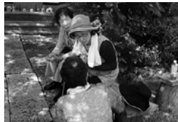
認知症高齢者対策① 挨拶はしゃがんで 目線合わせる