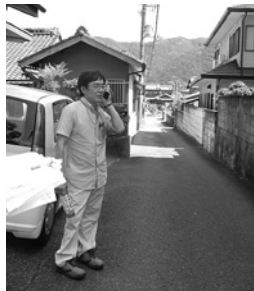
認知症高齢者対策② 警察に通報するときは 離れた場所で

は練習なのでできたが、現実には声をかけられるかな」「こんな場面に出くわしたら、冷静に今日のことを思い出して警察につなげたい」「人助けなのだから勇気をもって声をかけることが認知症サポーターの役割かな」という声がありました。また、認知症高齢者役からは、「笑顔で目線を合わせて話してくれるなど、安心できる配慮をしてくれた」「名前・住所だけでなく、しんどくないかなど体調面を気にかけてくれうれしかった」などの感想が寄せられました。今回は認知症サポーター養成講座（※）をかねて開催し、参加者全員が認知症サポーターとなりました。この取組みは今後も継続して実施していく予定です。警察庁調べによると、平成27年の全国で行方不明者数は約8万2千人、そのうち認知能力等の低下が原因と思われる方は約1万2千人あり、全体の約15%を占めます。紀美野町でも発生しており、例外ではありません。