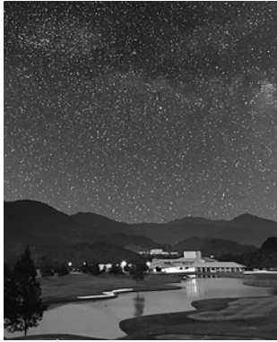
会場であるサンリゾートCCの星空 (イメージ写真)

皆さんもご都合の良い時間に遊びに来て下さい。イベント中は随時入退出可能です。詳細はイベント情報コーナーをご覧ください。