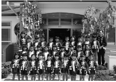
きみのこども園（年長）