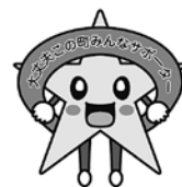
認知症にやさしい町・紀美野町キャラクター