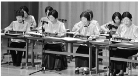
平成27年度文化祭「美里大正琴クラブ」と共演

無理なく、楽しく長くを実践しています。 ■日時 第2・4月曜日 9時30分～11時 ■場所 中央公民館控室