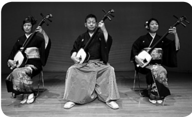
津軽三味線龍翔天舞