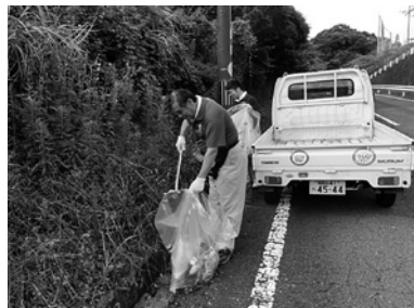
道路沿いで捨てられた空き缶やゴミなどを拾い集める参加者たち