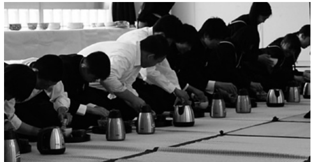
抹茶を点てる3年生

個別懇談のある12月14日にも3年生が「茶道体験」を実施する予定です。個別懇談の待ち時間や終了後に、保護者の方に点前を披露します。一服いかがですか。