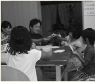
トランプで盛り上がる子どもたち

■費用 飲み物代(実費・100円程度) ■問い合わせ 保健福祉課 Tel 073・489・9960