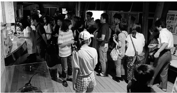
9月の観望会もお客様で賑わう。この日は136名が参加。(2016/9/10撮影)

協力事業者様は随時募集しています。「天文台と一緒にこんなことをしたら面白そうだ」というアイデアがありましたら、遠慮なくお声掛けください(TEL 073-498-0305)。天文台でのイベントのテーマやコンセプトは様々ですので、食品関係の事業者様だけではなく、様々な業種の方との連携が考えられます。一緒に紀美野町を盛り上げていきましょう!