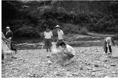
河川敷でゴミを拾う参加者たち

参加していただきました皆様方には、お忙しいところご協力いただきましてありがとうございます。