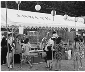
屋台を楽しむ参加者たち

この催しは、途絶えていた同小学校での地域の夏祭りをまちづくり協議会主導で昨年から復活させたものです。今年も地域の有志やボランティアサポーター、大学生の協力により盛大に開催することができました。