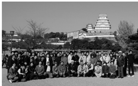
会員研修 集合写真