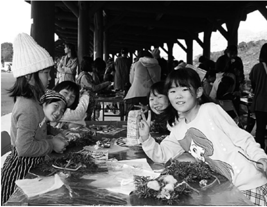
クリスマスリースを作る子どもたち

今年は「子どもたちに創り出す喜びと仲間とのふれあいを！」をテーマに「もちつき」「クリスマスリース」「ひょうきん」「キーホルダー」のコーナーで子ども達が真剣な表情で作品を作りました。また