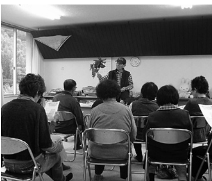
吉野ハッピーサロン 薬草の講話の様子