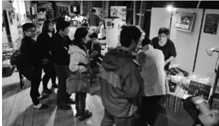
観望会の開始 40 分前からカフェには行列

年が明けた2017年2月25日(土)、3月18日(土)、25日(土)にも、同企画を計画しています。町内のカフェの皆様、極上の非日常体験と一緒に提供しませんか？協力店舗募集中！