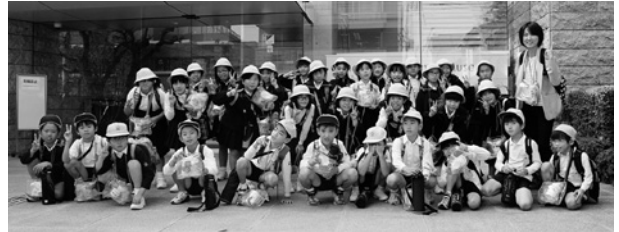
3年生 インスタントラーメン発明記念館にて

秋が深まる10月末。楽しみにしていた社会見学の日です。天候も良く、秋空の下のバス遠足となりました。低学年は大型児童館ビックバン、中学年はラーメン発明館、高学年はガス科学館等に出発です。社会見学にも「めあて」があります。高学年では、「実際に見たり、お話を聞いたりすることで学習を深める。また、きまりやマナーを守り、正しい集団行動をする」です。どの施設も身体で体感しながら学習をします。中学年では、マイカップ麺を作りました。カップには自分の好きな絵を描け、スープや具も自分の好みでアレンジできるのです。熱心に絵を描く児童たち。そして、自分のカップ麺が出来上がる様子を興味津々で見えています。見るだけで不思議感があり、インスタントラーメンづくりにもいろんな技術が使われていることが分かりました。これが土産となります。その後、やさしい日差しの中、公園でお弁当を食べ、よく遊んで帰校しました。どの学年も「めあて」を達成し、楽しい1日を過ごすことができました。