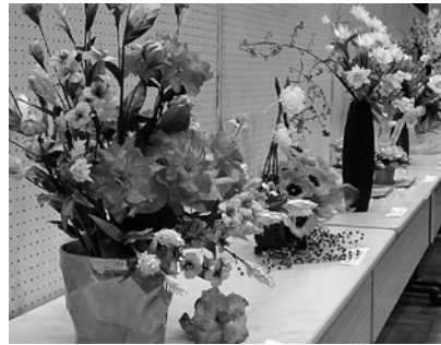
紀美野町文化祭の作品展示

日間、小川地区公民館にて作品展示会を開催しました。生け花や陶芸等の作品展示や、料理教室・人形劇・ナツメロなどもあり、地区の皆さんで盛り上げた作品展示会、たくさんの来場者で賑わいました。