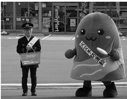
一日消防署長による街頭啓発