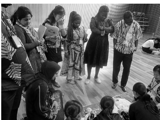
思春期講座にて赤ちゃんのお世話体験を見学

その後、きみのこども園内にある子育て支援センターの「コアラ教室」や野上中学校での「思春期講座」の授業を見学され、最後に総合福祉センターで母子保健推進員活動報告を熱心に聴かれた後、活発な意見交換が行われました。