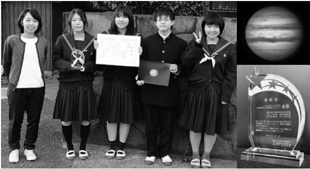
天文台に足を運んだ回数が多い橋本高校科学部と作品、特注トロフィー