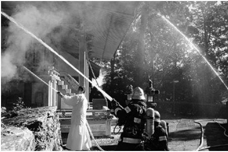
野上八幡宮での放水訓練の様子

文化財防火デーの1月26日、本殿などが国の重要文化財に指定されている十三神社（野中）と野上八幡宮（小畑）で宮司さんをはじめ消防署員、地元消防団員らが参加して防火訓練が行われました。訓練は境内から出火したという想定で、宮司さんによる初期消火、消防署への通報、境内に設置されている放水銃からの放水訓練と迅速に行われました。また、野上八幡宮では通報で駆けつけた消防署員によるタンク付消防車からの放水訓練も行われました。