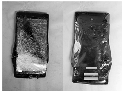
出火したリチウム電池内蔵のスマートフォン

近年、携帯充電器、スマートフォン、タブレット、電子たばこ、ノートパソコンなど様々な用途に用いられるリチウムイオン電池の充電中や使用中などに出火する火災が増えています。平成23年〜平成27年までに全国で65件の火災が発生しています。リチウムイオン電池の取扱いは十分注意してください。