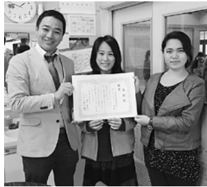
りら高校サイエンスアート部

これは提出締め切り前に慌てて写真を仕上げた生徒さんの言葉です。学問の面白さとはそういう事なのです。この企画を実施して大正解でした。