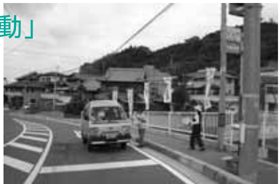
昨年の街頭啓発風景