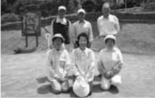
上位入賞者の皆さん