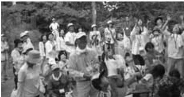
餅まきを楽しむ参加者たち

6月2日(土)、紀美野町青少年育成町民会議、育成委員会、野上スポーツクラブの主催で、紀美野町文化センターから蛇岩大明神までハイキングを開催しました。当日は、町内外より子どもから大人まで53名の方々の参加があり、薄曇りの絶好のハイキング日和に恵まれ、新緑に囲まれたコースをそれぞれのペースで歩きました。目的地の蛇岩大明神では、お弁当の後、蛇岩さんにお参りし、野草を観察したり、お餅まきを楽しんだりして過ごしました。