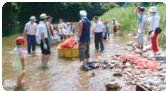
昨年の川そうじより