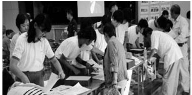
昨年9月1日に実施した下神野地区自主防災組織共催総合防災訓練「避難者登録訓練」の様子

また、24年度から取り組み、今年度で4回目となる下神野地区自主防災組織共催の「避難者登録及び避難所運営訓練」は、今年度は8月30日(日)に取り組みたいと計画しております。防災の取り組みを核に地域の方々との連携を密にしていきたいと思っておりますので、夏の暑い時期ですが、美里中学校体育館を第二次避難所と想定しての避難訓練です。「オイル缶鍋炊きご飯」の炊き出しや、起震車体験、煙体験、AED体験もありますので、ぜひご参加ください。