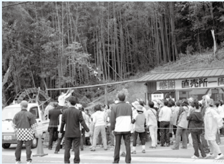
オープン1周年を祝っての“もちまき”

地元で採れた野菜などを販売する「小川の郷直売所」(小川地区寄合会)がオープンして1周年を迎えた生石高原山開きの日の4月29日(祝)に臨時営業し、登山客らに農産物や加工品などを販売するとともに、つくたての餅などをふるまったほか、餅まきも行われ、オープン1周年を祝いました。