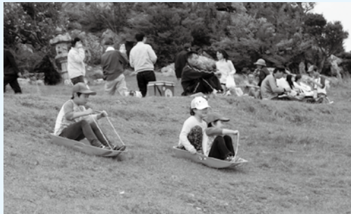
斜面でそり遊びを楽しむ子どもたち

訪れた人たちは、新緑の高原でお弁当を食べたり、太鼓演奏(吉備福祉太鼓)や恒例の景品付き餅投げを楽しんでいました。 広川町から家族3人できた女性は、「すごい人出ですね。子どもはそり遊びをしました。お餅も拾え、大変楽しかったです。」と話していました。 年間約8万人が訪れる生石高原は、これからハイキングやキャンプ、そして、秋のスキの名所として、県内外から多くの観光客でにぎわいます。