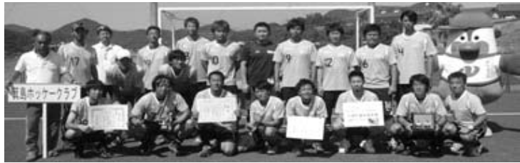
箕島ホッケークラブ(長崎国体にて)