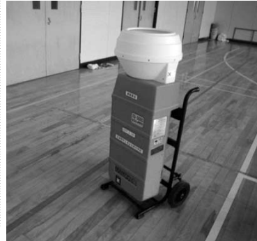
【長谷毛原中学校 ソフトテニスマシーン】

今後とも、当町の発展のために、引き続き多くの皆様からのご支援ご協力の程よろしくお願い申し上げます。