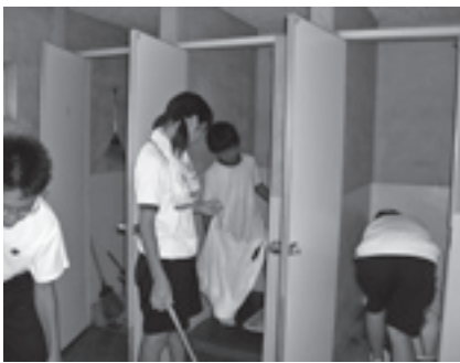
公衆トイレの掃除をする生徒たち

長谷毛原中学校の生徒の皆さん（14名）が、「いつもお世話になっている地域のためになることをしよう」と公衆トイレの掃除とごみ拾いを行いました。 同校では、毎年夏休みに自主活動を行っており、今年度は8月3日、4日と一泊二日で行われました。1日目は、学校の環境づくりの一つとして教室のペンキ塗りを行い、2日目は、長谷、毛原宮、大門橋方面の3つのグループに分かれて、生徒たちは、少しでも美しくしようと公衆トイレの便器を磨いたり、空き缶やたばこの吸い殻などを一生懸命拾っていました。 生徒の皆さん、暑い中、本当にご苦勞様でした。