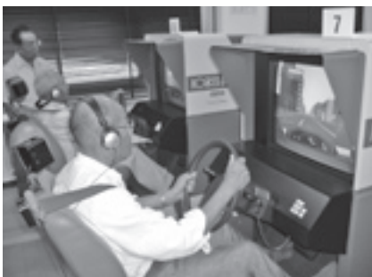
運転シミュレーションを体験する受講者

7月29日、第4回シルバー交通安全大学が「交通センター」と「交通管制センター」で開かれました。 受講者13名は、交通センターにおいて、(財)和歌山県交通安全協会から説明を受け運転シミュレーションを体験し、また交通管制センターでは、交通の流れを総合的に把握し、得られた情報をドライバーに提供する仕組みについて職員から説明を受けました。 シルバー交通安全大学は、本年4月に開校し、今月21日から始まる秋の全国交通安全運動期間中に5回目の講義を実施した後、閉校式を行う予定になっています。