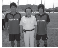
町長と記念撮影をする 福西選手（左） 阿部選手（右）

8月8日（土）にスポーツ公園多目的人工芝グラウンドにおいて、GESカップ2009 in KIMINO（小学生サッカー大会とサッカークリニック）が開催されゲストとして元日本代表の福西選手と元鹿島アントラーズの阿部選手が来町されました。子供たちは、初めて会う選手に緊張しながらも、一緒にプレーを楽しみました。