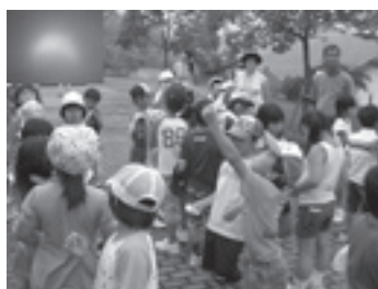
大きく欠けた太陽（左上）が雲間から一瞬見えた。

みかんの房のような形をした太陽を見ることができました。この度の日食では、様々な方にご協力いただき、ありがとうございました。次回は、3年後の金環日食です。お楽しみに。