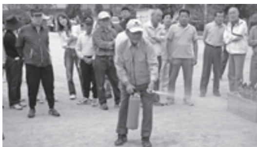
昨年の訓練の様（下佐々地区）

自主防災組織の訓練申込は、役場総務課（TEL 489-5912）までご連絡下さい。