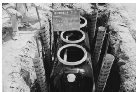
合併処理浄化槽の設置