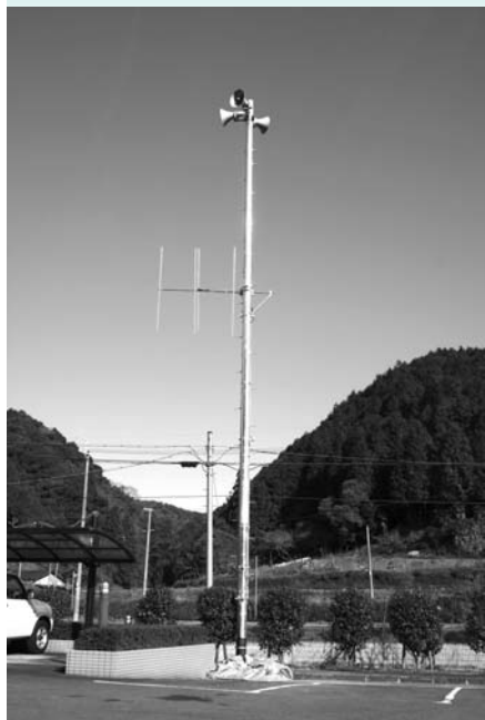
防災行政無線通信施設整備工事

現在、進められています平成19年度事業を見ますと、道路関係では、平中通り2号線や谷線など町道6路線、農道段子峯線、奥佐々阪井線（野鉄代替道路）など県道3路線、国道370号（2ヶ所）で、それぞれ新設・改良工事が行われています。