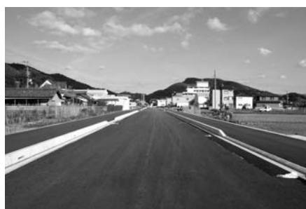
県道奥佐々阪井線（野鉄代替道路・小畑地区）