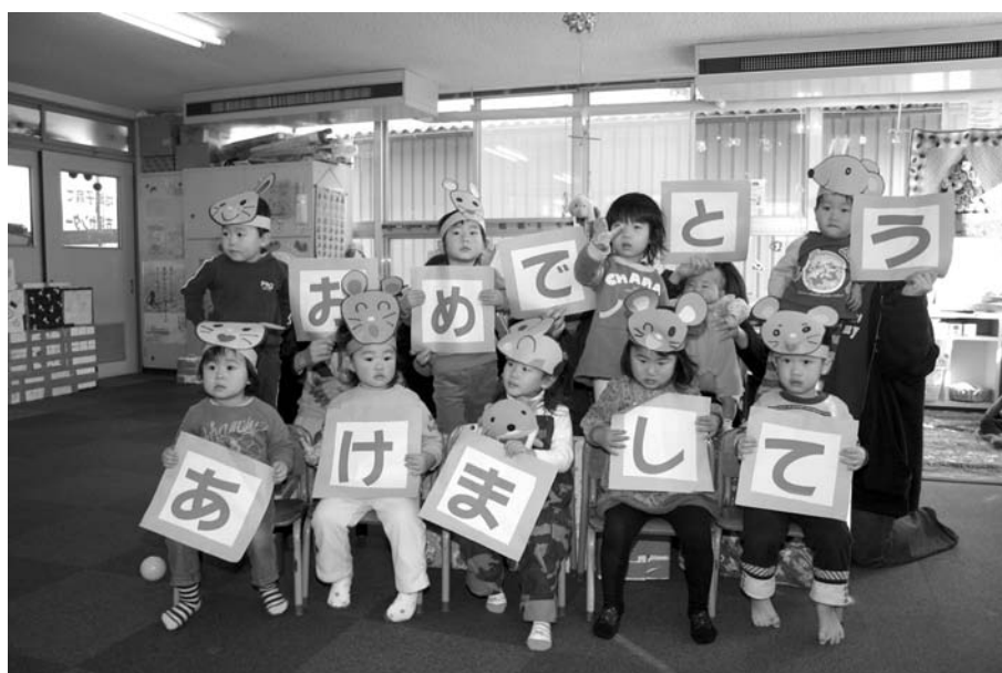
今年の子年。元気いっぱいの子どもたち(子育て支援センターにて)

今年も町民の皆様の変ら ぬご支援ご協力を賜りますよ うよろしくお願い申し上げます。 結びに、本年が皆様にとつ て希望に満ちた年となります よう心より祈念申し上げます。 新年のご挨拶と致します。