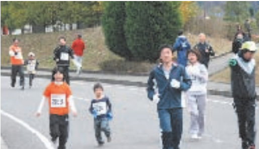
楽しそうに走る親子ペア

第2回紀美野ふれあ いマラソン大会が12月 16日(日)、のかみふれ あい公園周辺で開かれ、 町内はもとより、県内 をはじめ近畿各地域、 東京や山梨、高知から の参加もあり、約一、二 〇〇名が出場する大会 となりました。