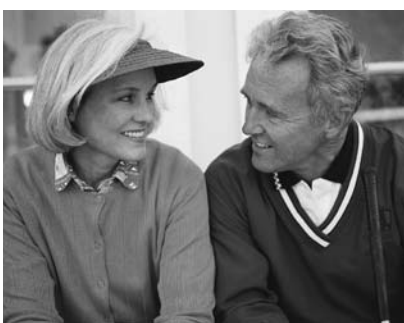
人生は老いてますますばら色に