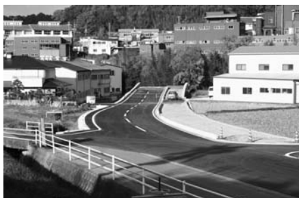
町道平中通り2号線（動木地区）