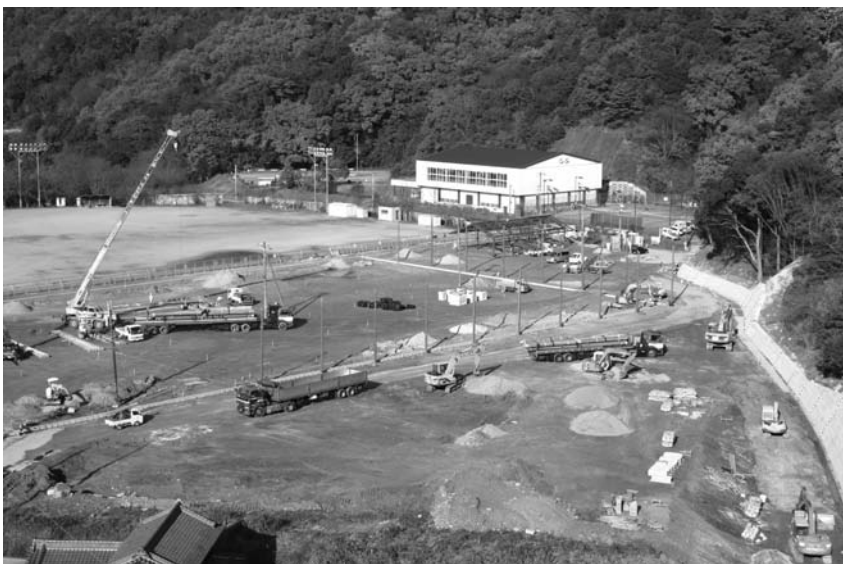
総合運動場リニューアル事業（動木地区）