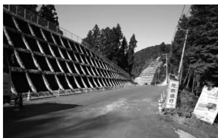
町道東福井牧場線（坂本地区）