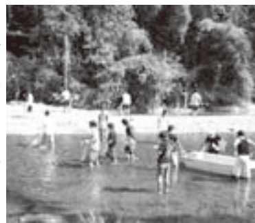
ボートを使ってゴミを回収する参加者たち

リバーサイドフェスティバル実行委員会が呼びかけ、9月5日(日)がたる大作戦が行われ、各種団体をはじめ一般参加者など約250人が貴志川の清掃作業を行いました。 午前9時から下佐々こども場で開会式があり、その後、参加者は7班に分かれ、貴志川(落合橋から小畑間)で一斉に清掃作業を開始。河原に捨てられた空き缶などを拾い集めました。7隻のボートも使われました。