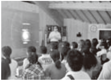
「Mitaka」を使って天の川について説明した観望会

学ぶ楽しさを実感した夢のような半年間、お世話になったみさと天文台の職員に感謝し、この体験を学校教育の場で活かすことで恩返ししたいと思います。