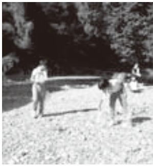
河川敷でゴミを拾う参加者たち

美里河川愛護会の呼びかけにより、8月28日(土)貴志川、真国川の一斉清掃が実施されました。中学生をはじめ各種団体一般参加者など多くの方々のご参加をいただき、河川敷、道路沿いに捨てられた空き缶、その他のごみの清掃作業を行いました。