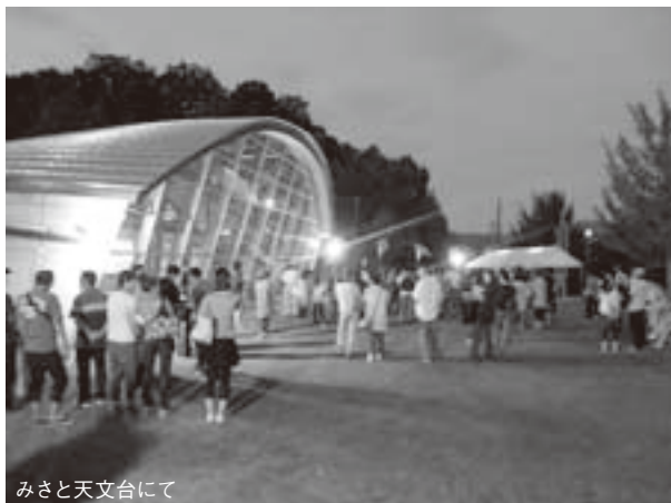
みさと天文台にて

のあいさつがあり、続いて参加者は、順番に自己紹介をしました。その後、セミナーハウス未来塾に移動し、バーベキューなどを楽しみながらお互いに交流を深められました。