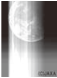
はやぶさが最後に撮影した地球

地球帰還で話題の「はやぶさ」。最新情報を始め、はやぶさが解明する宇宙の話題を分かりやすくお話していただきます。また、搭載されていたカメラ(同型試作機)を開西で初めて展示します。お楽しみに。