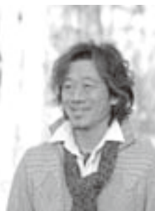
講師 柳生真吾氏 (園芸家)

幼い頃から、父柳生博氏の影響で自然に触れ、興味を持つようになり、ガーデニングを学び、2001年より「世界らん展日本大賞」審査員を務め、NHK教育テレビ「趣味の園芸」にメインキャスターとして長年出演されました。講演会では、八ヶ岳での生活を通して発見したことや、楽しみながら自然と付き合っていく方法などをお話いただきます。 また、みさと天文台研究員による宇宙と星空講座、ロビーにて、出張健康チェック(血圧・骨密度測定など)を行います。