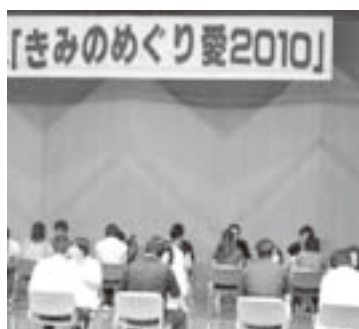
順番に自己紹介をする参加者(文化センター)

未婚の男女に出逢いの場を提供する婚活応援プロジェクト「きみのめぐり愛2010」(同実行委員会主催(紀美野町商工会青年部内)が去る9月12日、文化センター)で開かれ、町内外から64人(男性32人、女性32人)が参加しました。男性は、町内在住または在勤の方となっています。