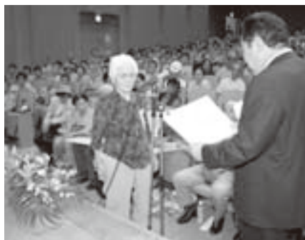
寺本町長より模範老人として表彰されるお年寄り