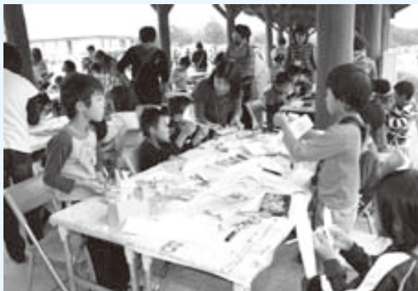
“ひこうき”を作る子どもたち

あと、炭火で焼いた「マガタマ」コーナーでは、ろうせきを紙やすりで、削るなど普段しないような体験をして、子どもたちも興味深そうに作っていました。各コーナースタッフ指導のもと、子どもたちが真剣な表情で作品を作ったり、仲間と楽しそうに遊んだりして、子どもたちの顔も生き生きと輝いていました。