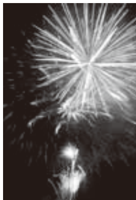
きみの夏祭り(8月15日)