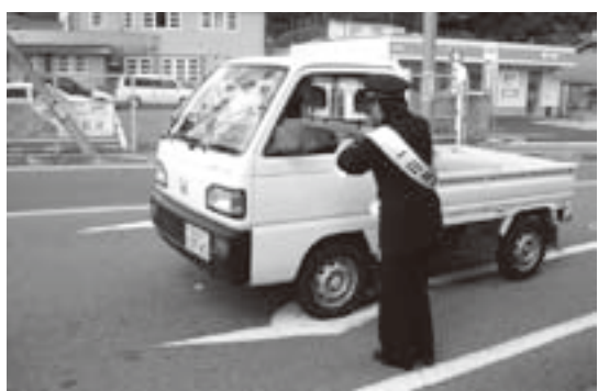
火災予防啓発活動の様子

尚、現在修了証をお持ちの方で前回受講してから今年中に2年を迎える方は、再講習を受講してください。