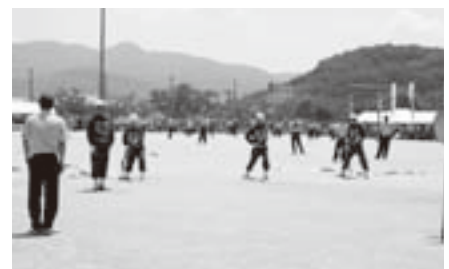
消防ポンプ操法大会(7月25日)