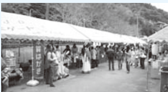
にぎわう国際交流ブース

30日は、各学校、児童団体より合唱や合奏が発表され、31日の芸能大会では、日頃の活動の成果が発揮され大変好評でした。