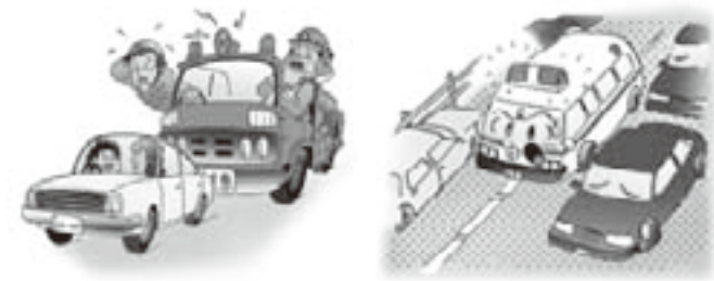
救急車に道を譲ってください。 カーステレオや話に夢中になると、サイレンが聞こえなくなります。

●緊急走行時にサイレンを鳴らすことは、法令で義務付けられています。夜間の緊急走行時のサイレン音に対して付近の皆さんのご理解をお願いします。