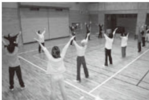
きみの八体操をする健康づくり教室のみなさん

10月27日、野上厚生総合病院の看護専門学校で行われた町健康づくり教室で、きみ八のつどい(小畑地区)のメンバー15人が「きみの八体操」を披露しました。きみ八のつどいオリジナルのこの体操は、紀美野町民歌を歌いながら、自分の体調や体力に合わせて無理のないようにゆったりと行うことができます。 参加者からは「町民歌に良く合っていて、楽しい体操です。」と話していました。