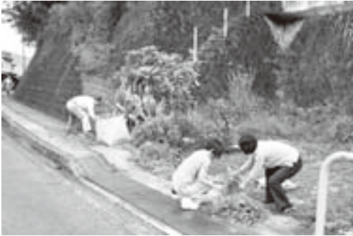
道路脇を清掃する住民の皆さん(下佐々地区で)

10月17日、町民一斉清掃が行われました。これは紀美野町青少年育成町民会議が提唱し、毎年5月と10月の第3日曜日に町内全域で実施されているもので、当日は各地域で早朝より多くの方々が道路