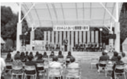
ふれあい公園開園10周年記念イベント(10月10日)