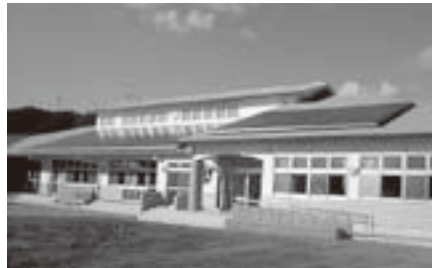
完成した野上第1保育所(1月11日)