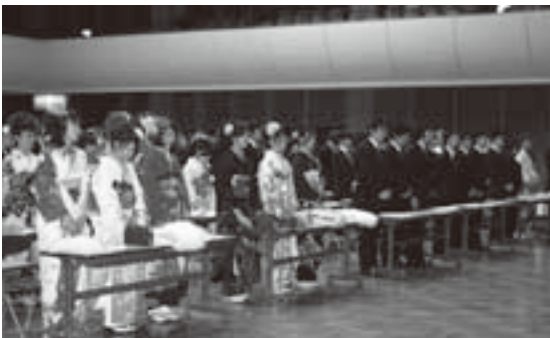
昨年の成人式より

※詳しくは教育委員会総務学事課 (Tel 489-5910) へお問い合わせください。