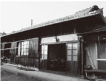
空き家になっていた家を生活体験施設として活用しています