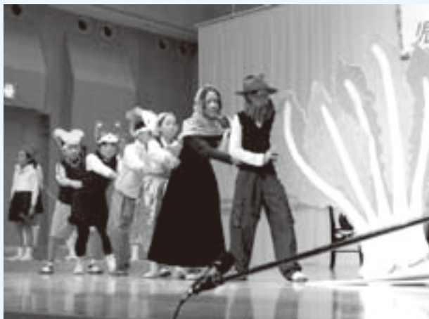
小川小学校の生徒による英語劇(児童生徒発表会)

10月30日（土）・31日（日）、11月1日（月）の3日間、中央公民館・文化センターにて第5回紀美野町文化祭を開催しました。保育園児から大人までの展示は、力作が勢ぞろいで来場された方々を楽しませてくれました。