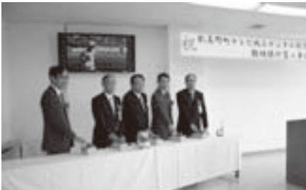
地上デジタル放送難視聴対策工事竣工記念式典(3月31日)