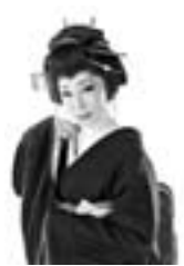
すわん江戸村 (劇団紀州)