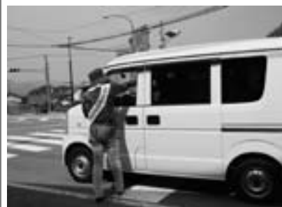
動木地区で実施された街頭啓発

年育成委員会、海南保健所の方々により街頭啓発や町内の小・中学校訪問が実施され、チラシや啓発用品を配って協力を呼びかけました