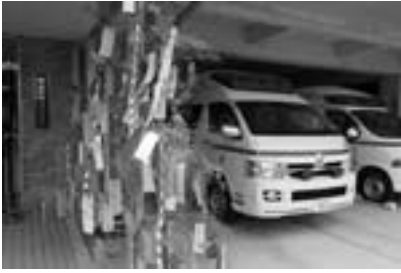
消防署前の笹飾り

園児たちは、「ひあそびしません」・「ひのようじん」といった防火の誓いや、「プリキュアになりたい」・「さっかーせんしゅになりたい」・「ケーキやさんになりたい」・「けいさつかんになりたい」など色々な願いのこもった短冊ときらびやかな飾りを笹いっばいに吊るした見事な笹飾りを完成させました。また、園児からいただいた