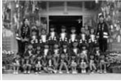
野上第1保育所（年長）