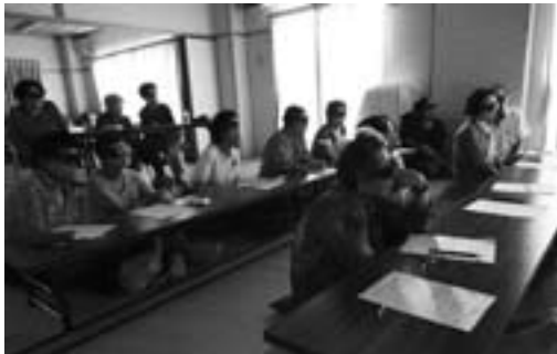
3Dメガネをかけ宇宙旅行を楽しむ皆さん

これからも各所に訪れ、星空のやさしいお話をしていきたいと考えています。我が地区の集会場に来て欲しいという方は、天文台や中央公民館、保健福祉課サロン担当などへ気軽にご連絡ください。お待ちしております。