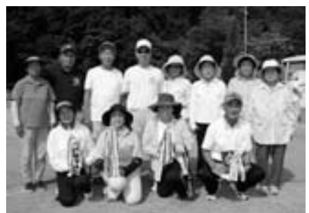
上位入賞チームの皆さん