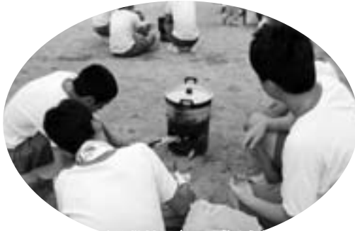
新聞紙を燃料にごはんを炊く中学生

下神野、福田、上神野地区の3つの自主防災組織が共催し、美里中学校との協力のもと9月1日、総合防災訓練が行われました。午後1時から同校体育館で行われた訓練には、自主防災組織の方々をはじめ美里中学校の生徒、学校関係者そして、下神野小学校と神野保育所の児童園児ら合わせて約150人が参加しました。訓練は体育館を第二次避難所と想定して行われ、中学生が避難者