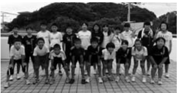
きみのAチームの選手たち

8月16日(土)きみのAチーム(20名)が県ドッジボール大会(白浜町立総合体育館)へ出場し、予選リーグAゾーン3位と健闘しました。