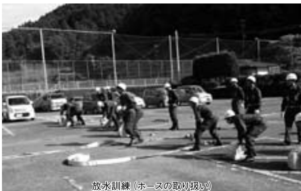
放水訓練(ホースの取り扱い)

の成果を十分に発揮され、地域の安全と安心の確保に尚一層のご活躍を期待しています。