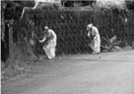
道路沿いで捨てられて空き缶などを拾い集める参加者たち

町内では、多くの人々が訪れる県動物愛護センターとのかみふれあい公園に通じる町道長谷国木原線をはじめ紀州サンリゾートラインなど5路線で、地元ボランティアや町職員ら約50名が参加して行われ、道路側溝などに捨てられた空き缶やゴミを拾い集めました。