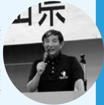
行政報告をする仁坂知事