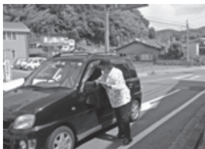
街頭啓発風景（野上郵便局前）