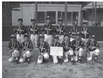
野上少年野球クラブの皆さん

当町より野上少年野球クラ ブ・美里スポーツ少年団が 参加し、野上少年野球クラ ブが見事、優勝しました。