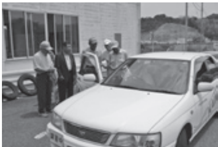
乗車時の注意点などを学ぶ受講者

シルバー交通安全大学は、高齢者の方々に交通安全の知識を身につけていただき、地域の模範になってもらうとうと開いているもので、今年度は4月に開校し、講座が5回実施されます。