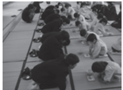
上手くお手前出来たかな～！？

習の時間」の一つの取組みとして実施しています。家庭科の学習に「幼児の生活」を学ぶ内容もあります。3年生にとっては保育所の園児とふれ合う中で貴重な体験ができました。