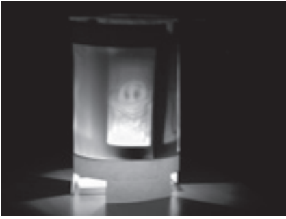
自分のかいた絵がまわるよ