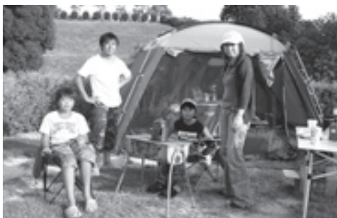
くつろぐ家族連れ

枚方市から家族4人で来られたという男性は、「ここへ来るのは2度目です。施設も充実しており、2泊3日のキャンプを楽しみます。」と話していました。