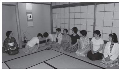
■お稽古日 毎月第2・4月曜 午後7時30分~ ■場所 中央公民館和室