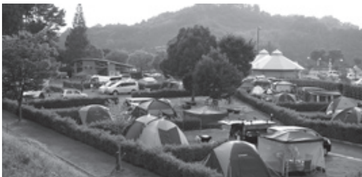
満杯のふれあい公園オートキャンプ場（7月18日）