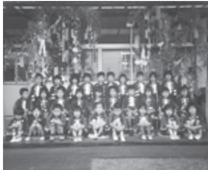
野上第1保育所（年長）