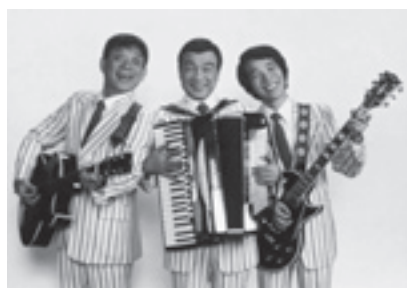
横山ホットブラザーズ