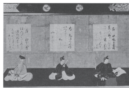
野上八幡宮扁額 三十六歌仙図