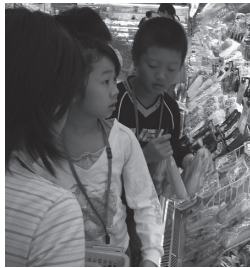
夕飯の材料を買い物中

10月13日(火)～17日(土)に中央公民館と自然体験世代交流センターを生活の場として、異年齢の児童が集まり、通常の学校生活を送る中で、生きる力を育むために通学合宿を開催します。夕方から都合の付く時間で、調理などの指導をしています。