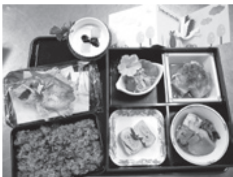
メッセージカードが添えられた産褥食