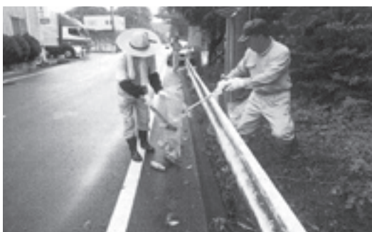
空き缶などのゴミを拾い集める参加者たち

8月23日(土)に紀州路クリーン大作戦'08が実施され、県下一斉に道路清掃が行われました。町内では、多くの人々が訪れる県動物愛護センターとかみふれあい公園に通じる町道長谷国木原線と町道志賀野井ノ口線で、地元ボランティアや町職員ら約30名が参加して行われ、道路側溝などに捨てられた空き缶やゴミを拾い集めました。参加されました皆様、残暑さびしい中、本当にご苦勞様でした。