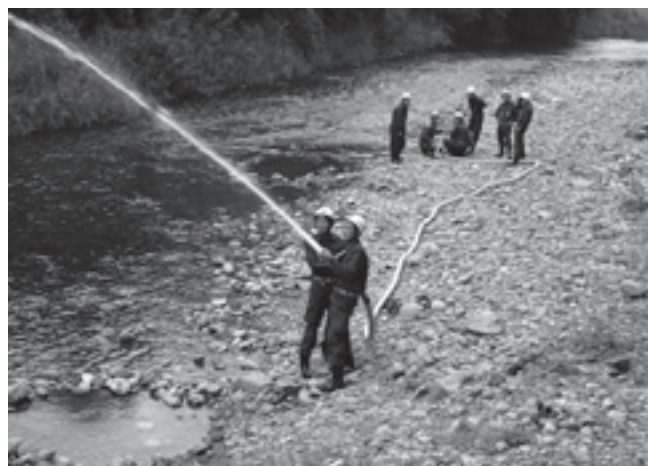
放水訓練をする新入団員(可搬ポンプ操作)

新入団員のみなさんは、終日汗まみれになり、熱心に訓練に励まれました。 訓練を受けられた新入団員さんには、町民の生命と財産を守るため、訓練の成果を十二分に発揮され、地域の安全と安心の確保に尚一層のご活躍をお願い致します。