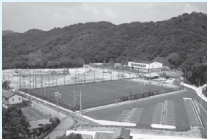
多目的人工芝グラウンドと工事が進む多目的グラウンド(野球場等/写真後方)

平成27年(2015年)開催の第70回国民体育大会(和歌山国体)において、本年5月に新しく完成しました紀美野町総合運動場の多目的人工芝グラウンドが、正式競技であるホッケー競技の会場地として、内定されました。