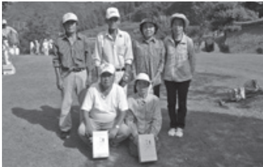
上位入賞された皆さん