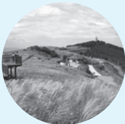
ススキが見頃の生石高原

9月13日から15日まで、ススキの穂が風になびく生石高原で、仲秋の名月「ジャズコンサート」が山の家おいしで開かれました。