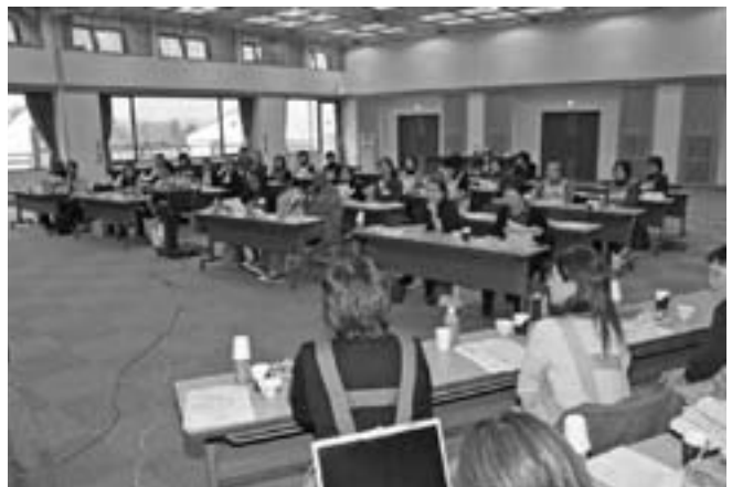
行政説明(総合福祉センター)

うことです。自分た ちの国で母子の健康 状態の改善を図るた め、今日見学させて いただいたことを参 考にしていきたいと 思います。」と研修 のお礼と感想が述べ られました。