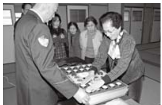
反射年齢を計るお年寄り

このほか、反射測定器で反射年齢を計るコーナーもあり、実年齢との差を比べられていました。