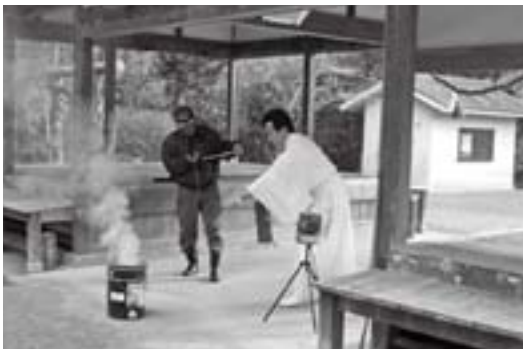
消火器による初期消火訓練(十三神社)▶

文化財防火デーの1月26日、国の重要文化財に指定されている野上八幡宮(小畑地区)と十三神社(野中地区)で、神社と消防本部、地元消防団員が参加して防火訓練が行われました。