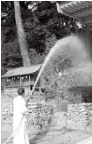
▲放水訓練(野上八幡宮)

る消火器による初期消火、消防署への通報、境内に設置されている放水銃での放水、そして、通報で駆けつけた消防署員によるタンク付消防車からの放水が行われ、関係者らが緊張した表情で訓練に取り組んでいました。 町民の財産である文化財をみんなで火災から守り、後世に受け継いでいきたいと思います。