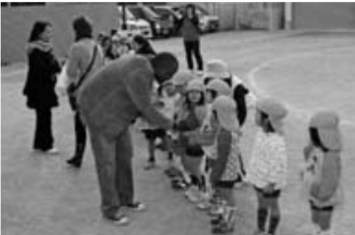
園児たちが迎えてくれました。(野上第一保育所)

午後は、野上中学 校に移動し吹奏楽演 奏の歓迎を受けた後、 3年生の「思春期学 習」を見学しました。 その後、最後に総合 福祉センターで行政 説明と質疑応答を行 いました。