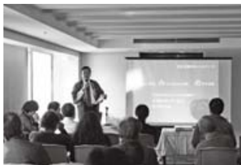
「和歌山田舎暮らしセミナー紀美野町編」の様子

いました。 セミナー終了後、来場者の方々から「海、山、川に近い紀美野町にぜひ行きたい。」という声を頂きました。