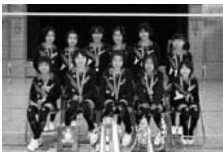
6年生への思い出の一枚