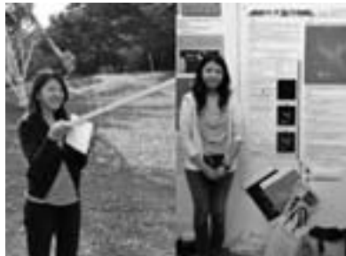
学会発表（右写真）やイベント準備（左写真）等、天文台での経験は良い思い出です。

また、紀美野町の素晴らしい星空には何度も感動しました。特に流星群の夜が印象に残っています。一生の思い出となりました。これからも天文台での経験を活かしてがんばっていききたいと思います。