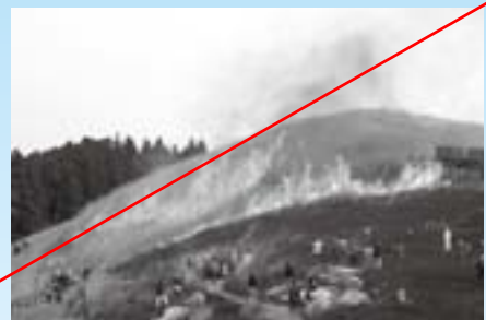
昨年の山焼きより

今年の生石高原山焼きを、下記のとおり実施します。山頂笠石周辺に観光客のための観覧場所を設けておりますので、是非ご来場下さい。