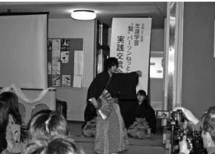
伝統芸能を披露する同校の生徒たち