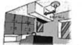
天井から15～30cmの間に火災警報器の中心が来るようにします。