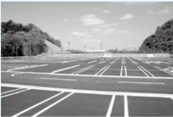
完成した駐車場 (収容台数380台)