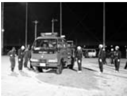
消防署員の指導のもと、訓練に励む選手たち

来る7月25日、紀美野町スポーツ公園において開催される和歌山県主催の第23回和歌山県消防ポンプ操法大会に、紀美野町消防団第1分団（下佐々地区）がポンプ車操法の部に出場します。