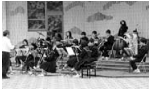
(4月に行われた中庭パフォーマンス)

現在、新1年生が部活動の見学などを行い、正式に部活動に入部したところです。全校生徒171名が全ての部活動に所属して活動を行っています。昨年度、運動部では県大会や近畿大会へ3つの運動部が出場するとともに、文化部では吹奏楽部が県大会で銀賞を獲得するなどの活躍をしています。学校全体で取り組んでいる駅伝部は、この紀美野町で開かれた県大会において男子優勝、女子2位と健闘し、男子は2年連続して全国大会に出場しました。この伝統を受け継ぎ、今年も頑張っていきますのでご声援よろしくお願ひします。