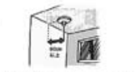
〔壁の取付の場合〕 天井から15～30cmの間に火災警報器の中心が来るようにします。

〔天井の場合〕 火災警報器の中心を壁から30cm以上離します。 〔壁の取付の場合〕 煙がたまりやすい天井の隅の付近に— 煙検知器やエアファンなどの取付点から1.5m以上離します。