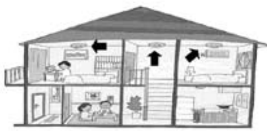
実際に取り付けてみましょう

〔天井の場合〕 火災警報器の中心を壁から30cm以上離します。 〔壁の取付の場合〕 煙がたまりやすい天井の隅の付近に— 煙検知器やエアファンなどの取付点から1.5m以上離します。