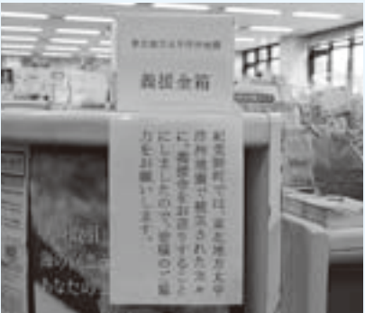
役場本庁(受付)に設置された義援金箱