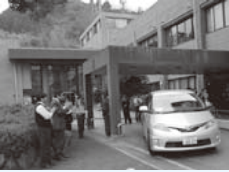
被災地に向け役場本庁を出発する職員(3月15日)

紀美野町としてもできるかぎりの協力を続けていきます。今後も皆さまのあたたかご協力をお願いします。