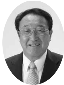
町長 寺本 嘉光