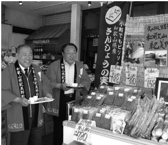
生山椒を店頭販売する寺本町長とスーパースーパー山田屋の社長(スーパースーパー山田屋・久津川店(京都府城陽市))

続いて、例年お世話になっています城陽市のスーパースーパー山田屋(久津川店)にて、生山椒の店頭販売を町長、町職員