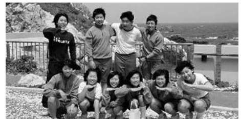
1年生9人 in 白崎海洋公園

また、昨年度から防災の取組を核に地域の方々との連携を密にしており、社会福祉協議会の協力を得て、6月26日に「避難所ボランティアについて」の講演会を持ち、9月2日には昨年度より規模を拡大して、下神野地区自主防災組織の方々と共催で、地域の方々と共に「災害対応美里中学校第2避難所想定避難訓練」を計画しております。