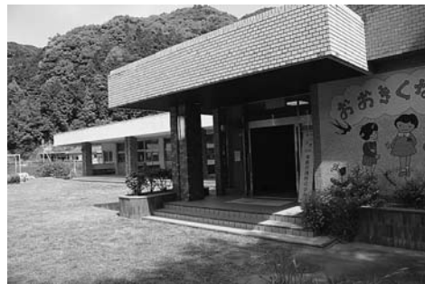
小川地区寄合会の活動拠点となる小川保育所

施設の概要は、鉄骨造平屋建て、延べ床面積177.98㎡。11月末完成予定となっています。