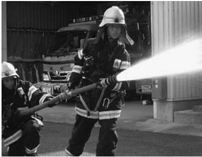
放水訓練の様子 (美里中学校)

日の3日間には野上中学校の生徒4名が職場体験学習のため消防署にて、救急・救助・放水訓練等の仕事を体験し、防火意識の高揚と救命活動に対する正しい認識を深めました。