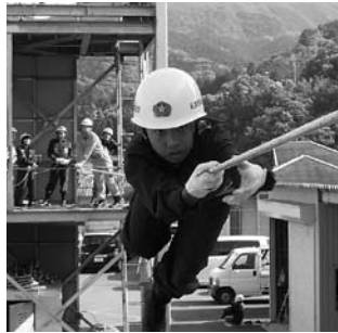
渡過訓練の様子 (野上中学校)

救急訓練では救急車の車内見学や、普通救命講習を受講し、心肺蘇生法の必要性を学びました。救助訓練ではロープ結索訓練や高所をロープで渡る渡過訓練を体験し、初めての経験にもかかわらずみなな渡りました。放水訓練では重い防火服を着装し、ホースの延長の仕方や実際に水を飛ばしての訓練等を実施しました。生徒達はたくさん汗をかきながら一生懸命訓練に取り組みました。