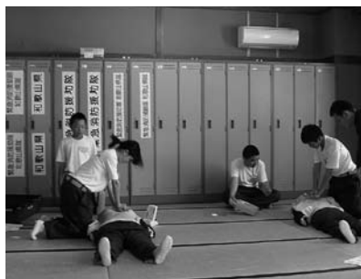
普通救命講習の様子 (野上中学校)