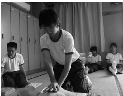
普通救命講習の様子 (美里中学校)