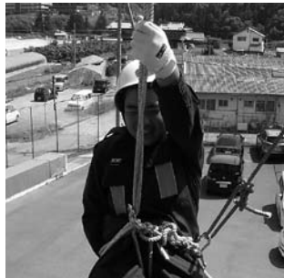
ロープ降下訓練の様子 (野上中学校)