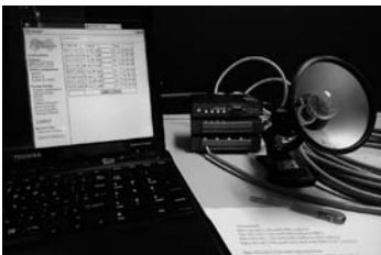
展示のためパソコンから電灯を制御する試験をしています

今回は電気代の値上げもあり、さらなる対策に遮熱塗料を塗ってみました。また、望遠鏡ドーム内の展示を音と光を使ったものに一新しました。進化する天文台をお楽しみに。