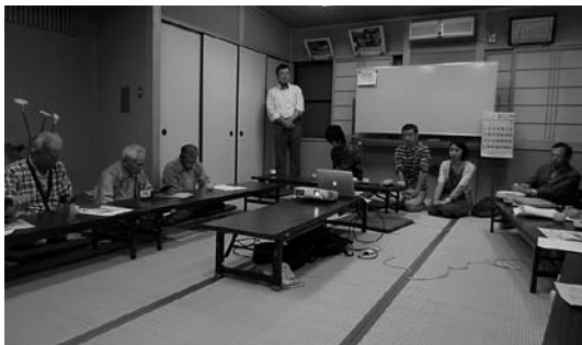
桂瀬地区での地域説明会の様子

紀美野町が定住支援事業を行っていることについて、まだまだ知らない方も多いのが現状です。今後、この事業を進めていくには、地域の皆様のご理解と協力が大変重要と考えて、各地域で説明会を開催していきますので、よろしくお願い致します。