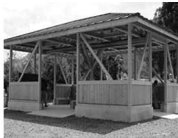
西野地区東屋外観

西野地区の活動に役立てて欲しいという寄附者の要望を反映し、ご寄附いただきました400万円を「紀美野町西野地区東屋新設」に充当させていただきます。