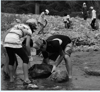
昨年の川そうじより

がたる大作戦とは、貴志川の水辺や水中の空き缶やゴミなどを拾って、貴志川を美しくしようとする活動です。みなさんもぜひご参加ください。なお、当日は濡れたり、汚れたりしますので、対応できるご用意をお願いします。 ■日時 7月28日(日) 当日悪天候(川の増水含む)の場合は、8月4日(日)の場合同様、8月4日(日)午前9時～11時30分まで受付 午前8時40分～開会式 午前9時(下佐々こども広場) ■場所 次の場所へ集まってください。 開会式終了後、スタッフが各清掃場所に向かいます。軍手、ごみ袋等はスタッフが持参します。 ○吉野 小川橋下河原 ○下佐々 小川橋下河原 ○平、吉見 吉見橋下河原 ○動木 龍光寺橋詰 ○小畑 さんまい河原