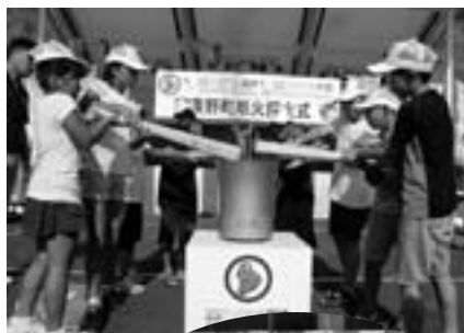
「まいぎり式」の火おこし器を使って火をおこす児童