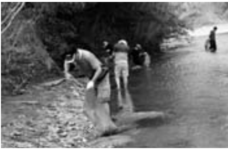
河原のゴミを回収する参加者

8月2日（日）、がたる大作戦（貴志川の清掃作業）が各種団体をはじめ地元子供会、一般参加者など約200人が参加して行われました。この清掃活動は、リバーサイドフェスティバル実行委員会が、貴志川をべっぴんさんに