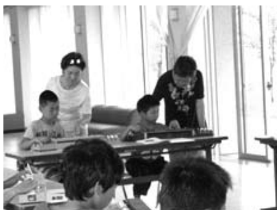
「1年生も頑張っています」