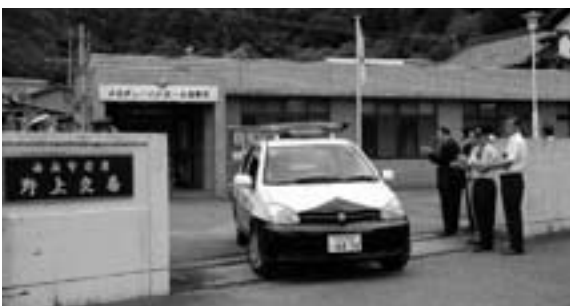
パトロールに出発するパトカー (野上交番)

第1回目の捕獲活動を6月28日(日)に、実施隊員38名が3グループに分かれ、紀美野町内3地区(動木、真国、毛原)で捕獲活動を実施し、イノシシ7頭、シカ3頭を捕獲しました。【産業課】