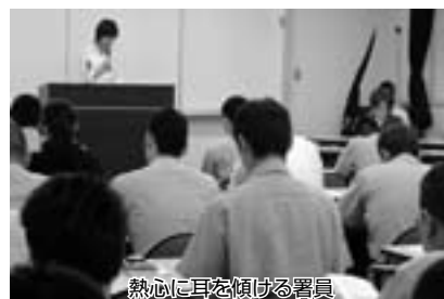
熱心に耳を傾ける署員