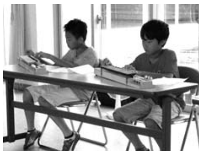
「なかなか難しいな!」

7月22日(水)文化センターふれあいルームにて、「美里大正琴クラブ」の皆さんのご協力により大正琴を体験しました。弾き方や譜面の見方など優しく丁寧に教えてくださいました。最後に大正琴クラブの皆さんによる演奏を聴くことができ、楽しいひと時を過ごしました。