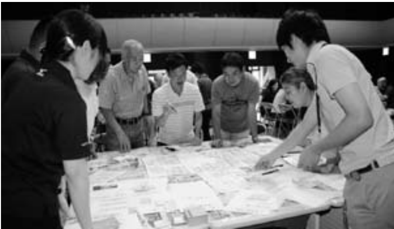
避難所運営ゲームで、避難者情報カードを配置する参加者

その後、8人程のグループに分かれ、避難者情報が書かれたカードを使って行う避難所運営ゲーム(HUG)を体験。コントローラー役が避難者の情報カードを読み上げ、そのカードをグループ内で検討しながら、避難所に想定した小学校の平面図に配置していく演習(カード200枚)を約3時間行いました。