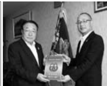
寺本町長より次本代表理事組合長に交付されました。

7月30日、紀美野町長室に於いて本町消防団活動に多大なるご支援、ご協力をいただいております「ながみね農業協同組合」様に対し、本町で