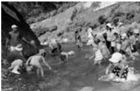
鮎つかみを楽しむ園児たち