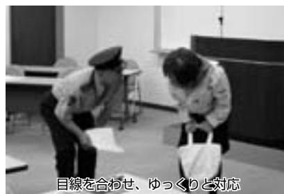
目線を合わせ、ゆっくりと対応