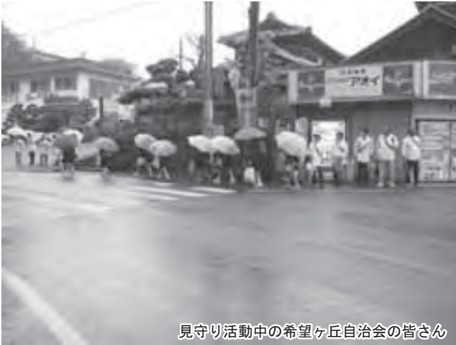
見守り活動中の希望ヶ丘自治会の皆さん

全国各地で下校途中の子どもが被害に遭う事件が多発していることを受け、紀美野町では、地域のみなさんのボランティアによる「きみの見守りボランティア」を募集しています。