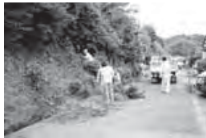
道路周辺の草刈りを行う住民の皆さん (希望ヶ丘団地で)