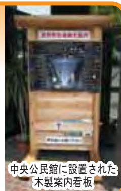
中央公民館に設置された木製案内看板

統一ルートマークは、町内28箇所に設置されており、高野までの距離と現在地が表示されています。又町内の案内ができるよう、ポスター掲示板やパンフレットが入る木製案内看板を設置して、町内外の方々に情報を提供していきます。