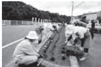
県道横の花壇に花を植える住民の皆さん (長谷地区で)