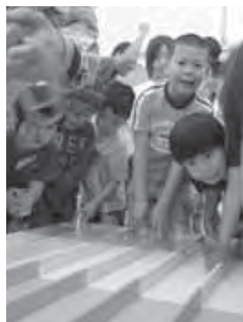
がんばれ～！ゴールまでもう少しだ！

毎年恒例、5月5日（こどもの日）のさわがにレースは、悪天候が予想されるにもかかわらず、予想を上回り200名を超える方の参加で大盛況となりました。