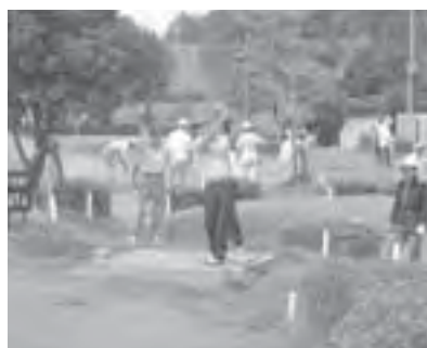
昨年の大会の風景

■昨年実施できなかった山 草展を開催します。 かわいい山草に出会いに来 てください。