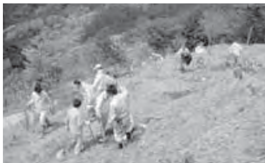
広葉樹の苗木を植える社員の皆さん

「企業の森」は、企業や労働組合、大学などの方々に環境貢献活動や地域との交流活動の一環として、県内の森林環境保全に様々なかたちで取り組んでいただく事業です。まず、三井和歌山工場長と