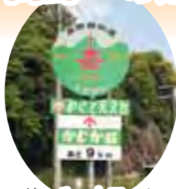
統一ルートマーク

紀美野町を東西に横断する国道370号線を世界遺産高野山へ通じる「高野西街道」と名付け、紀美野町まちづくり推進協議会により高野への道しるべ（統一ルートマークと木製の観光案内看板）が設置されました。