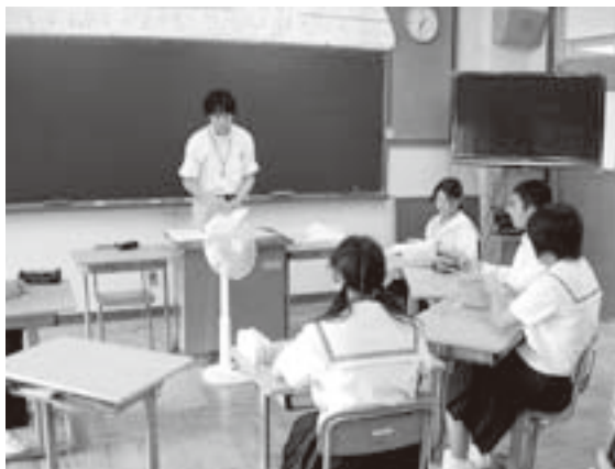
長谷毛原中学校で開かれた租税教室