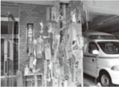
消防署前の笹飾り

園児たちは、「ひあそびしません」・「ひのようじん」といった防火の誓いや「ウルトラマンになりたい」・「プリキュアになりたい」・「しょうぼうしになりたい」・「かんごしさんになりたい」・「やきゅうせんしゅになりたい」・「おはなやさんになりたい」などと色々な願いのこもった短冊ときらびやかな飾りを笹いっばいに吊るした見事な笹飾りを完成させました。