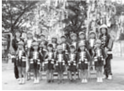
野上第1保育所(年長)

また、園児からいただいた笹飾りを消防署前に飾りつけると、ドライブバーなど道行く人へひととき華やかに防火のPRを果たしてくれました。