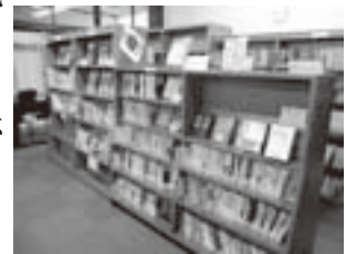
中央公民館図書室