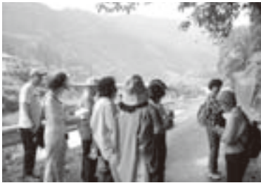
活動 毎月第1土曜日午後2時~ 中央公民館