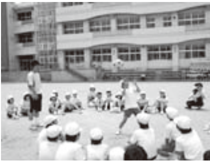
6年生たちを指導する元日本代表の中西永輔さん

6月17日、野上小学校で1998年のワールドカップ(W杯)フランス大会に出場された中西永輔さん(37)を招いてのサッカー教室が開かれました。これは、子どもたちに一流のスポーツ選手の実技指導や話を聞くことでスポーツに関心を持ってもらおうと文部科学省・日本体育協会のスポーツ選手活用体力向上事業の一環として行われました。