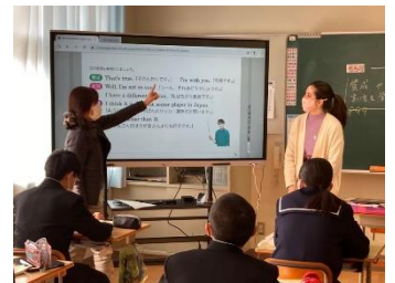
▲ 電子黒板を使った ICT 教育と ALT による英語の授業風景