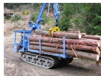
▲ 林業機械での集材と運搬

森林環境譲与税を財源とし、計画的な間伐等の生産を推進するため、林業高性能機械のリース代の一部を補助します。