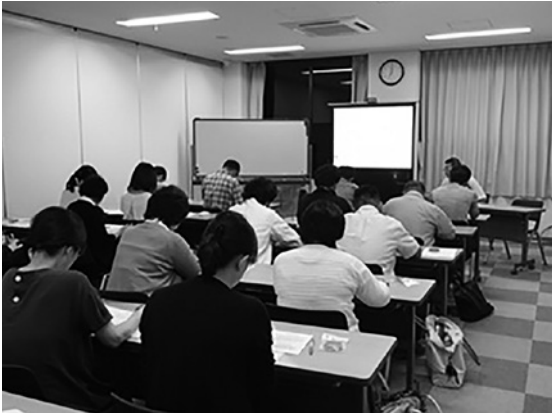
認知症サポーター養成講座の受講の様子