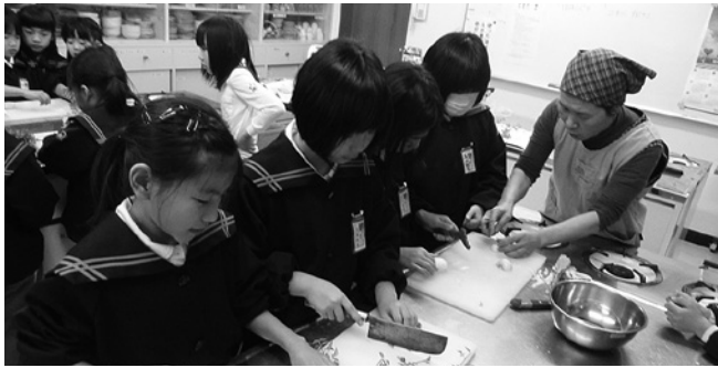
1月10日に七草粥を作りました。(中央公民館)

今年から監督を務めさせてください。このジュニア駅伝を通して、「子ども達に何かを伝えられたら」、「紀美野町のためになれたら」そういう思いで今年も長期間の練習を重ね、大会に挑みました。