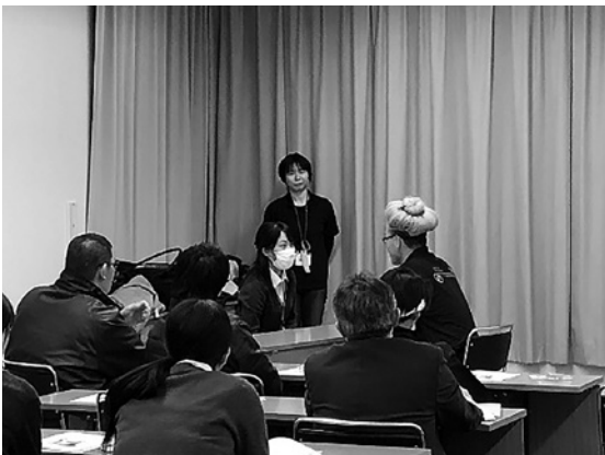
認知症の方との接し方体験の様子

平成29年9月に紀美野町内郵便局職員、平成30年1月にながみね農協野上支店職員を対象に、認知症サポーター養成講座を開催しました。認知症という病気や認知症の人への接し方について、講話と寸劇で理解を深めていただき、講座終了時には認知症サポーターの証であるオレンジリングをお渡ししました。受講者からは、「認知症といっても色々な種類があることを知った」「認知症にかかわらず、優しいゆっくりとした口調で接したいと改めて思った」「家族も認知症なので対応の仕方な