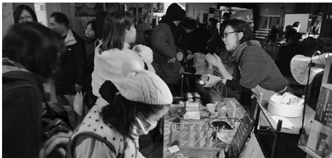
ごった返す天文台カフェ。1月31日の月食観望会には約200人が参加した。

その仕掛けの1つは、天文台Webサイト等への町内飲食店の掲載です。ランチ・夕食どちらかでもご協力いただける場合、みさと天文台友の会事務局へご連絡ください。