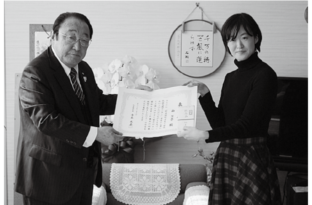
愛称表彰式の様子

子どもを授かった時には、まわりの人たちと心と心のつながりを大切にしてほしい。そして、何か困った時には、すぐに子育て世代包括支援センターへ電話をかけられるように、電話番号が覚えやすい愛称にしました。