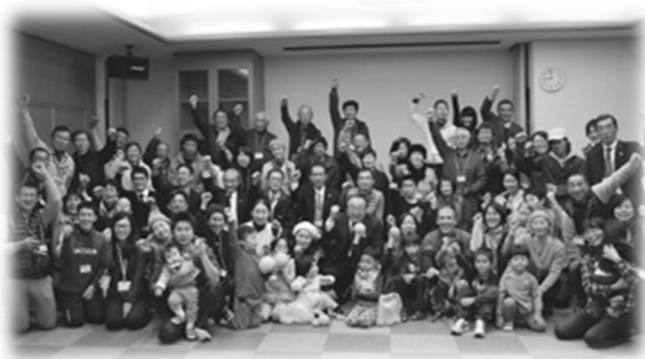
きみの定住を支援する会