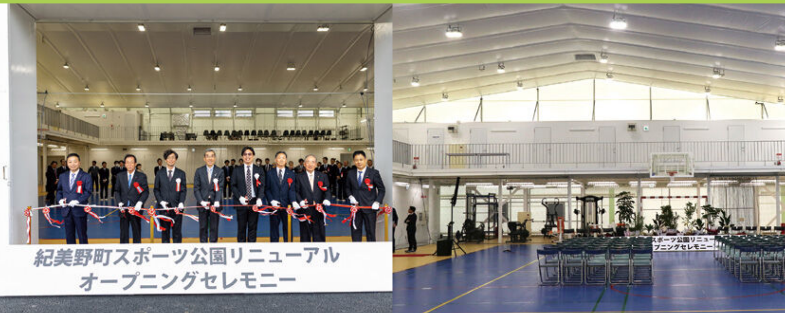
紀美野町スポーツ公園リニューアル オープニングセレモニー