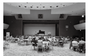
※前回の開催時の様子

■問合せ・申込み：中央公民館 Tel 489 - 2877 (火曜・祝日を除く9時～17時)