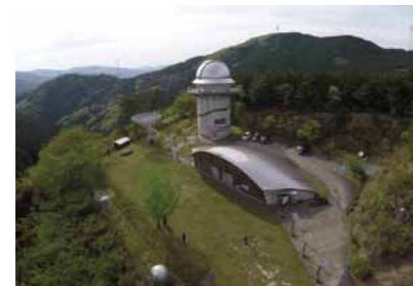
みさと天文台全景