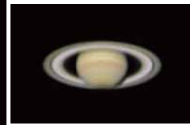
カセグレン式望遠鏡

月明かりの無い良く晴れた夜空には肉眼で天の川を見ることが出来ます。和歌山県最大の大型望遠鏡を直接覗き、月のクレーターや土星の環、星雲・星団などを愉しんでいただけます。暗い夜空と大きな望遠鏡ならではの雄大な星空体験をお楽しみください。 土日祝日の昼間にはプラネタリウムや3D(立体)映像の上映で宇宙旅行気分を味わっていただけます。番組の上映ではなく、上映日毎に異なる内容を研究員が生解説いたします。