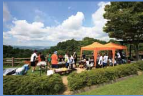
バーベキューサイト