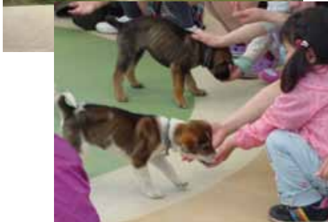
和歌山県動物愛護センター