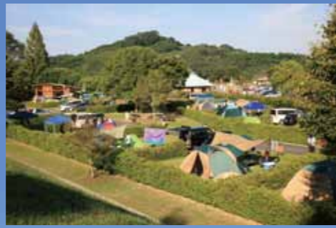
オートキャンプ場