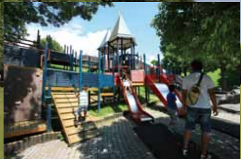
わんぱく広場「冒険ノアディ城」