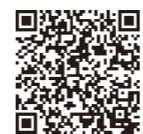
小川町長インタビュー動画

本町が策定した長期総合計画では「住民活力でつくるまちづくり」をスローガンに掲げています。町民のみなさんとともに子育て支援策、移住定住施策等を積極的に展開していき、数ある田舎の中で「紀美野町に住みたい、住んでよかった」と思っていたいただけるまちにしていきたい。誠心誠意努めて参ります。最後になりましたが、この度町勢要覧を作成するにあたり、ご協力いただきました全ての皆様に感謝申し上げます。今後のまちづくりにも、引き続きお力添えを頂ければ幸いです。