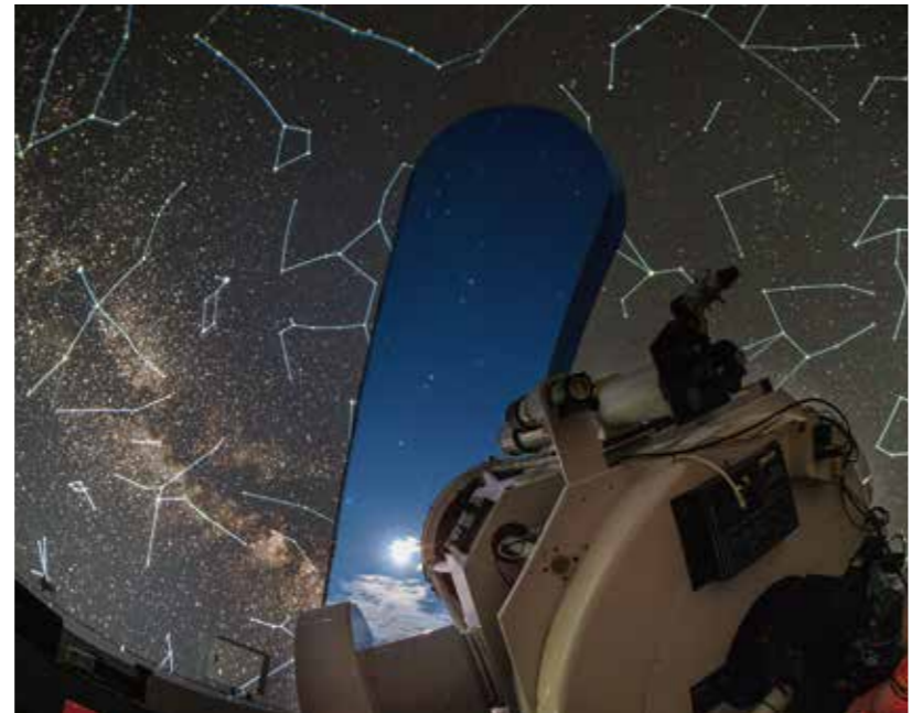
デジタル全天周投影機を備え、星空が投影できる天体観測室

みさと天文台は、以上のような様々な工夫を続けながら、星の魅力を発信する教育・観光・交流の拠点として、紀美野町の発展に貢献していきます。