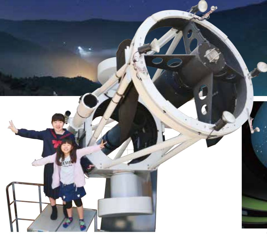
一般公開用としては日本でも屈指の口径105cmの反射望遠鏡で本格的なスターウォッチングが楽しめます。