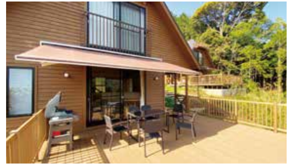
星の動物園バンガロー

2021年、天文台と一緒にリニューアルした全3棟の宿泊施設です。大自然の中でバーベキューを楽しんだり、満天の星空を眺めることができます。