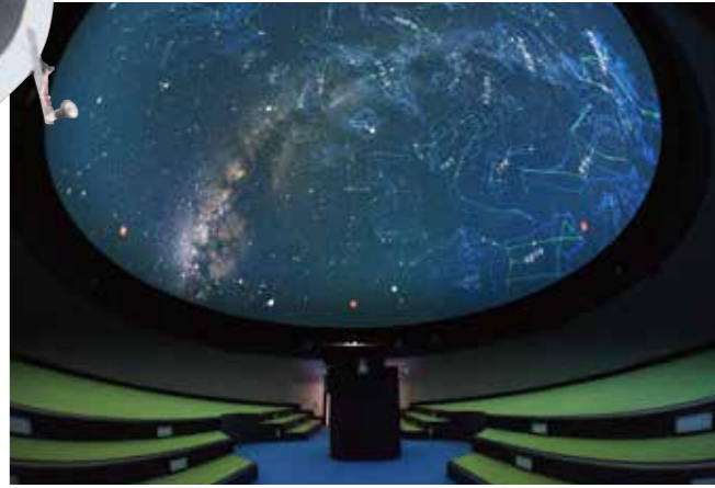
多目的ホールとしても使えるプラネタリウム投影室