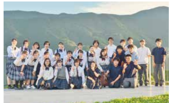
天文台で実施した近畿大学附属和歌山高等学校1年生の星空教室