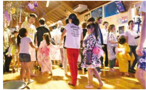
浴衣で星空ツアーに参加するイベント

定期催しの中心である「プラネタリウム」3Dシアターによる宇宙の旅「星空ツアーNEXT」は、一貫してライブ解説で実施してきました。季節ごとに変わる星空・天体と、