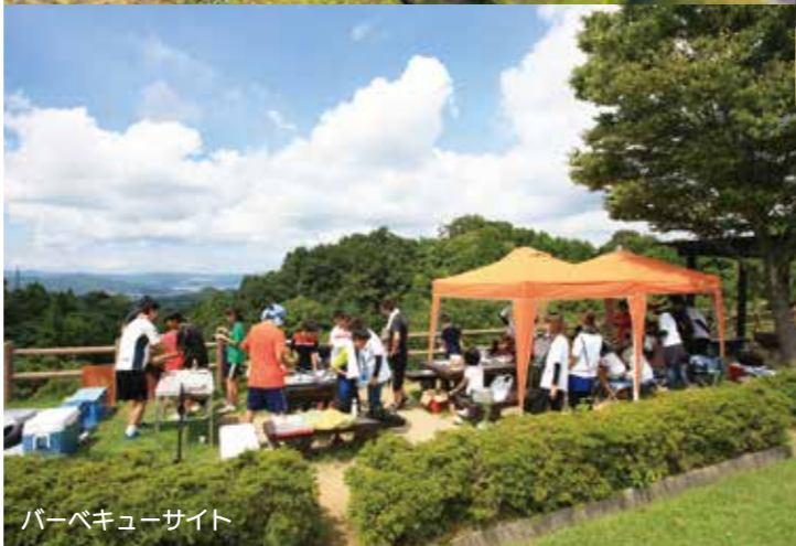
バーベキューサイト