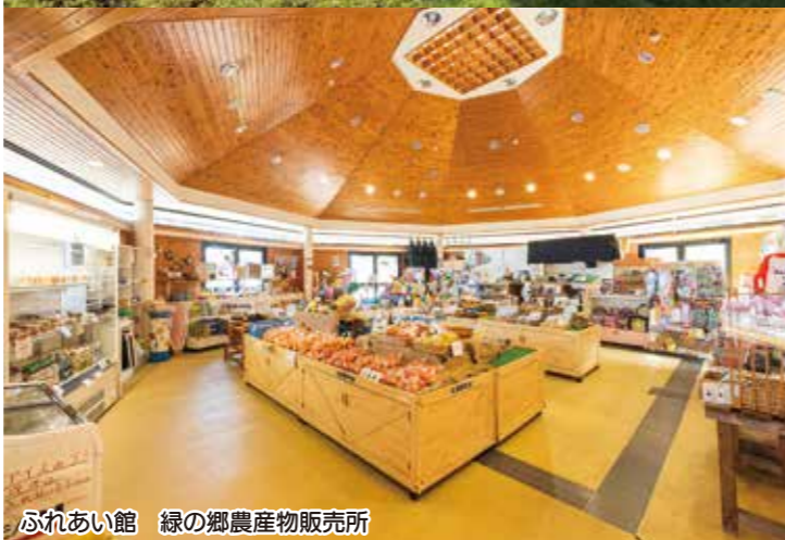
ふれあい館 緑の郷農産物販売所