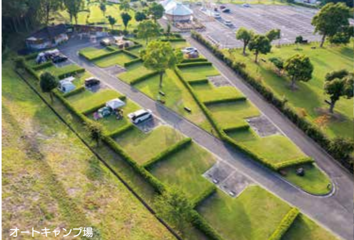
オートキャンプ場

真国川を見下ろす山の頂にあるのかみふれあい公園は「ふれあい」をテーマとして、子どもから大人まで自然とふれあいながら余暇を楽しめる公園として整備されています。 一面に芝生を敷き詰めた1万平方メートルの広大な面積を誇る芝生ひろばは、柔らかな感触の芝の上でピクニックを楽しめるほか、イベント開催用の屋外ステージもあります。子どもたちに大人気の巨大な遊具「冒険ノアディ城」があるわんぱく広場、この頂上にある展望台から眺める風景は壮観です。 各サイトにAC電源を完備し、共同施設として、炊事棟、水洗トイレ、シャワー、ランドリーを備えたオートキャンプ場のほかにも仲間や家族と楽しめるバーベキューサイト、地元農産品の販売や喫茶・軽食が楽しめるふれあい館、町内のスポーツイベントなどでも利用されている36ホールを備えた日本パークゴルフ協会公認のパークゴルフ場があります。