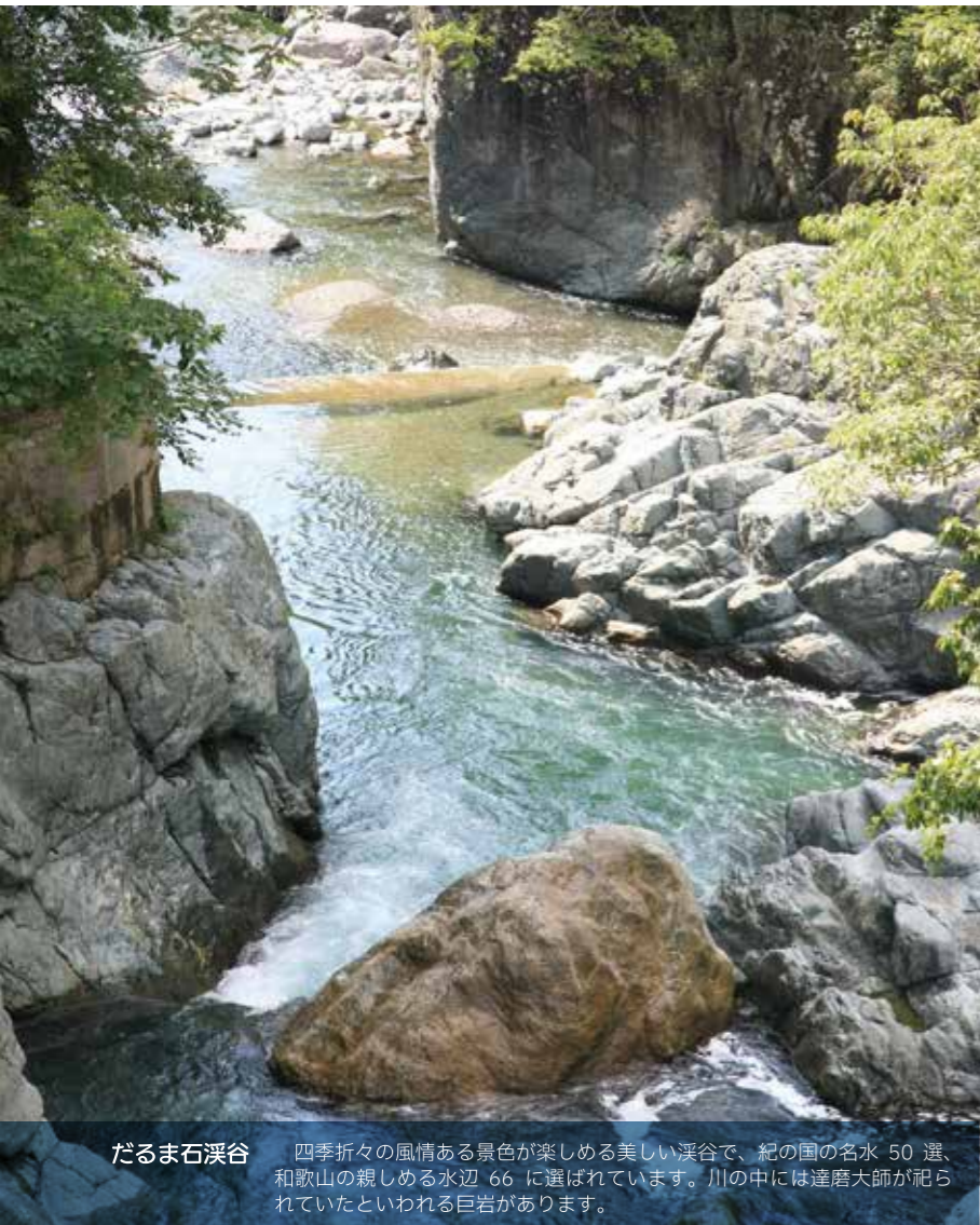
だるま石溪谷 四季折々の風情ある景色が楽しめる美しい渓谷で、紀の国の名水 50 選、 和歌山の親しめる水辺 66 に選ばれています。川の中には達磨大師が祀ら れていたといわれる巨岩があります。