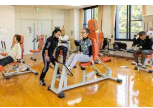
健康アップ・チャレンジ教室