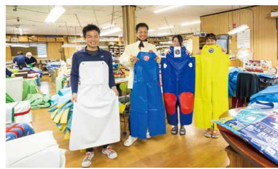
防水・防寒着製造