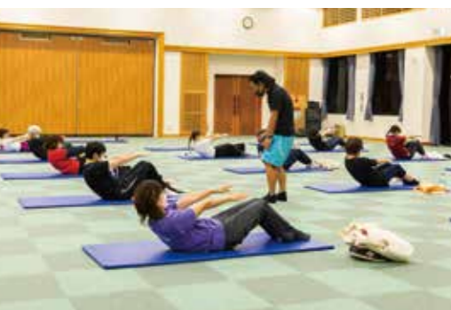
美ボディトレーニング