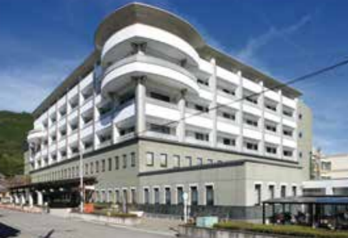
国保野上厚生総合病院