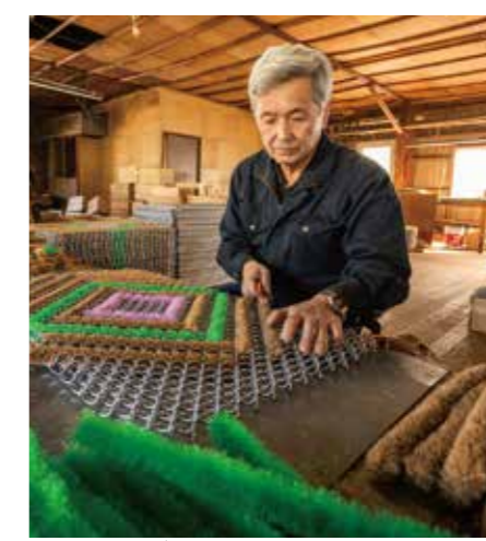
棕櫚玄関マット製造