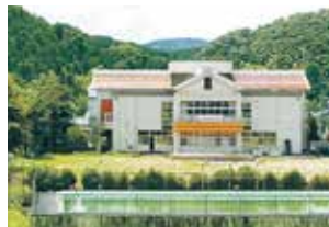
りら創造芸術高等学校

町内には全日制・普通科の県立高等学校として海南高等学校大成校舎と美里分校の2校、私立高等学校として、文化・芸術などの創作活動に特徴のある、りら創造芸術高等学校、野球・テニス・ゴルフ等スポーツが活発で通信制の慶風高等学校の2校があります。また、高等学校卒業後に看護師をめざす方には野上厚生総合病院附属看護専門学校があり、学生の個性や将来の夢を見据えた進路を選べます。