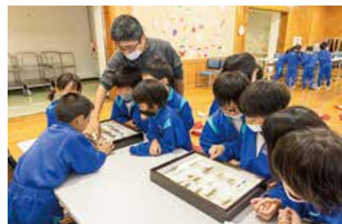
町内小学校交流授業(昆虫学習)