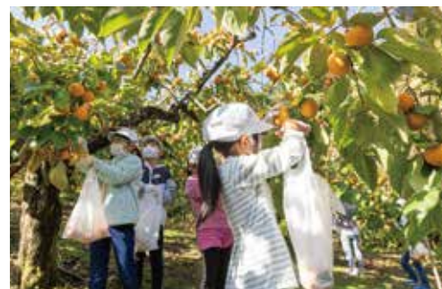
課外授業(柿の収穫体験)