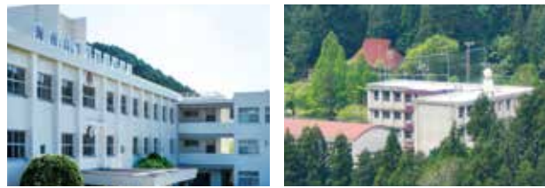
海南高等学校大成校舎