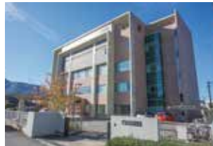
国保野上厚生総合病院附属看護専門学校