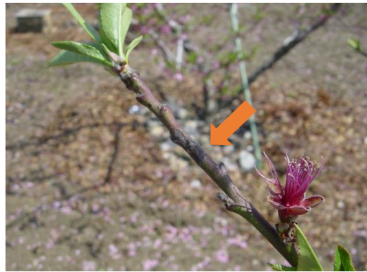
写真 モモせん孔細菌病の春型枝病斑（芽の枯死、紫褐色～紫黒色の病斑）